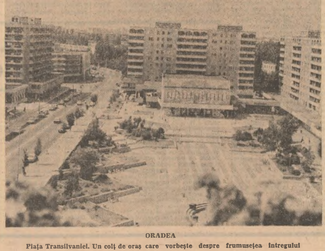
Piața Transilvaniei. Un colț de oraș care vorbește despre frumusețea întregului

MONICA ZVIRJINSCHI (Continuare în pag. a II-a)