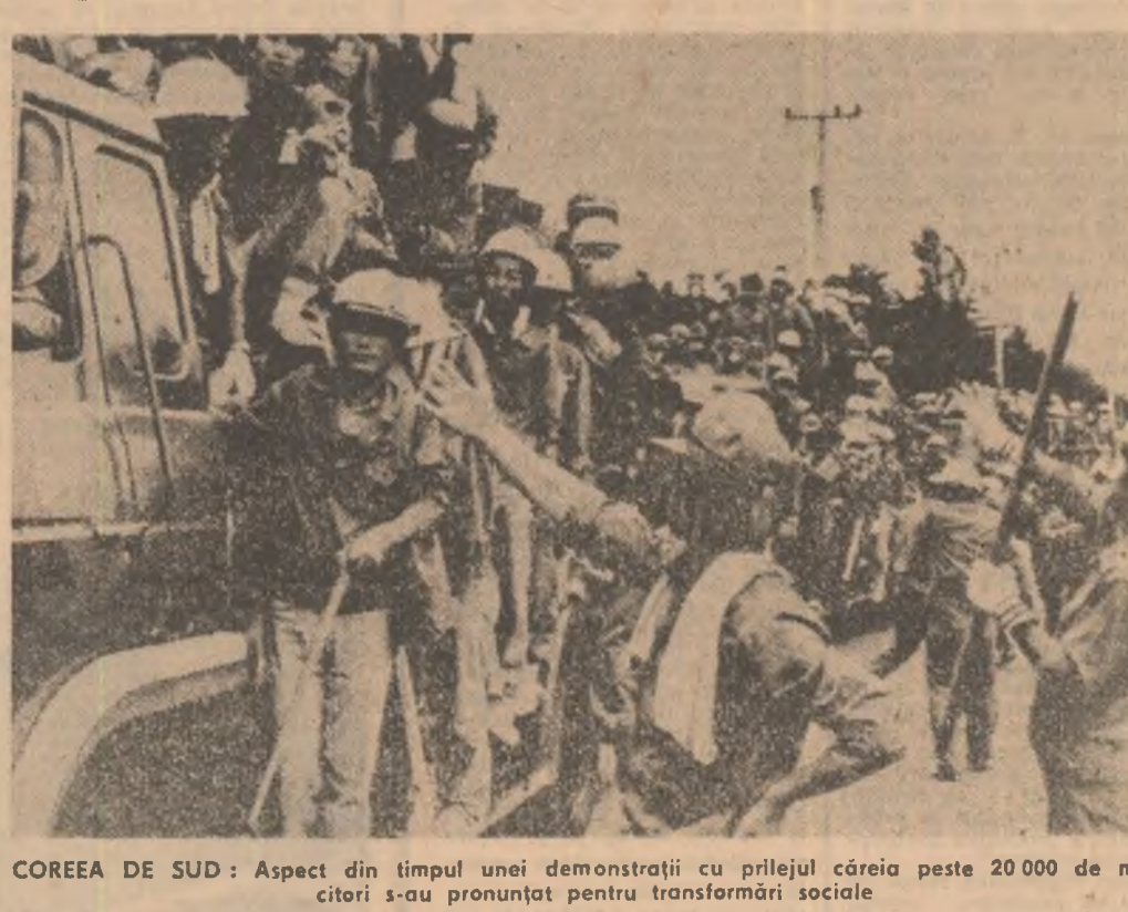
COREEA DE SUD: Aspect din timpul unei demonstrații cu prilejul căreia peste 20.000 de muncitori s-au pronunțat pentru transformări sociale

SEUL 9 (Agerpres). — La Seul s-a desfășurat duminică o amplă demonstrație de protest a studenților împotriva regimului dictatorial al lui Chun Dun Hwan. Au participat aproximativ 20.000 de persoane. În cursul unui miting s-a cerut asigurarea unor condiții echitabile de desfășurare a alegerilor prezidențiale din luna decembrie. Agențiile de presă relatează că s-au produs ciocniri între studenți și poliție, care a fost împotriva acestora gaze lacrimogene și bastoane de cauciuc. Peste 50 de studenți au fost arestați.