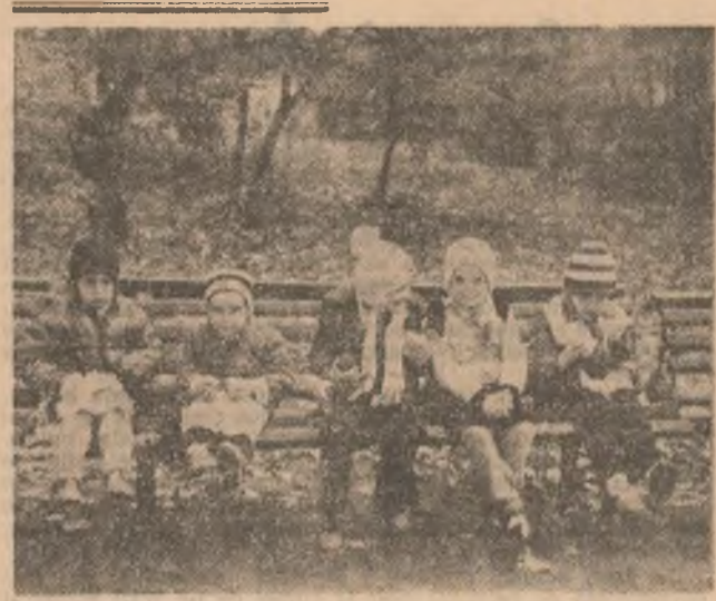
Mic dejun pe covorul de frunze...