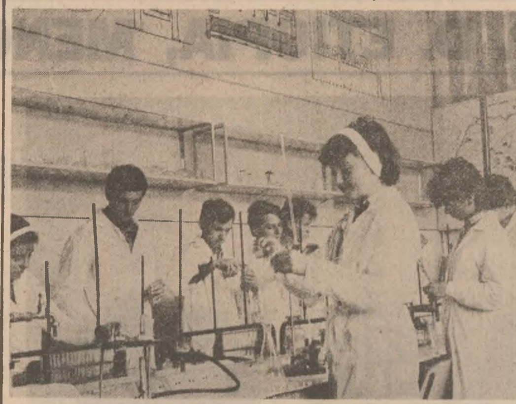
Laboratorul de chimie: o nouă experiență probează cunoștințele, dar și îndemnarea

Revenim mereu asupra unei teme: a impactului adolescentului testat de pe băncile școlii, cu exigențele vieții în general și cu marile responsabilități ale vieții de uzină în special. De modul în care tînrul a fost pregătit (și a pregătit el însuși) depinde, în primul pas, de credința în forțele lui. În primul pas este, după cum se știe, foarte important. Așadar, școlii îi revine o mare răspundere în ceea ce privește educarea tînrului pentru societate, pentru muncă, pentru viață.