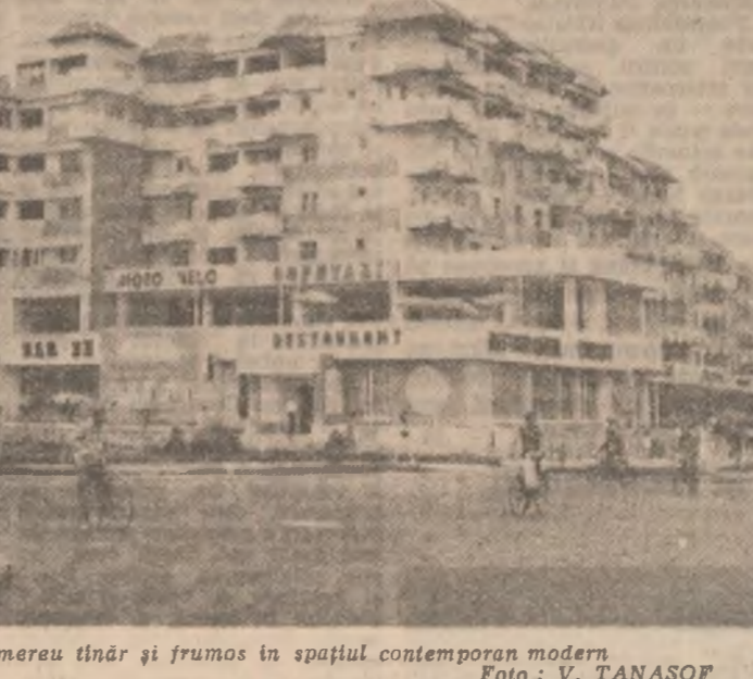
Râmnicu Sărat — mereu tânăr și frumos în spațiul contemporan modern.