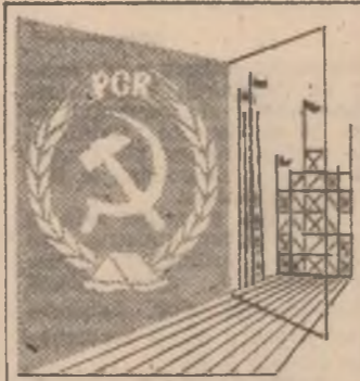
CONFERINȚA NAȚIONALĂ A PARTIDULUI

tehnice, muncii pline de abnegație ale oamenilor țării, în rândul cărora tinerii și-au făcut simțită prezența în mod exemplar. Cifrele sînt impresionante: s-au excavat peste 70 milioane mc de pământ și rocă (pentru a croi drumul noului canal s-a săpat, în unele locuri, în plată dintr-o pîndă la o adîncime de 73 m!), cu fost necesare 6 milioane mc de umpluturi în mări, s-au turnat 250 000 mc de beton, s-au consolidat taluze pe o suprafață de 1 135 mii mp. Peste 7 300 de brigadieri, din aproape toate județele țării, au muncit aici în perioada mai 1984 — noiembrie 1986, valoarea totală a lucrărilor executate fiind de 800 milioane lei. Tronsonul realizat de brigadierii a conștientizat, practic, o nouă filă înscrisă în cronică muncii pentru țară și cuprind, cifric, execuția a 8,2 milioane mc pământ și rocă, turnarea a 30 000 mc de beton, execuția a 200 000 mc de proiectii mării, 4 km de diguri, 20 km de drumuri tehnologice, precum și alte lucrări. A fost un imens efort, a fost, în primul rând, o lătură cu recorduri stabilite la celălalt Canal, pentru că mușii, foarte mulți dintre brigadierii de la Poarta Albă —