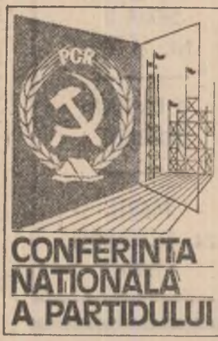
CONFERINȚA NAȚIONALĂ A PARTIDULUI