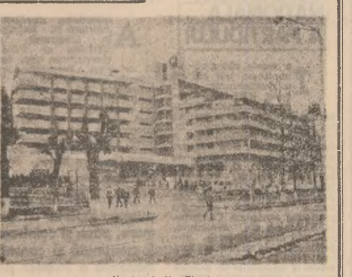
Ilustrată din Simiza