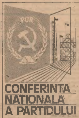
CONFERINȚA NAȚIONALĂ A PARTIDULUI

toare. E adevărat, sînt eminaționate necesare, dar hotărîtoare se dovedește a fi sporirea responsabilității oamenilor muncii ilustrată clovent prin intensificarea activităților în fiecare secție, precum și la nivelul colectivului coordonator al responsabilității pe diferite probleme ce privesc exportul. Bunăoară, la nivelul secțiilor se află constituite colective care urmăresc producția, de la lansare, pe toate cele 3 schimburi, și pînă la livrarea produselor în dispozitiv de produse finite. Aici, în acest ultim sector, acționează o echipă special constituită care execută paletrizarea produselor, reverberificarea ambalajelor, urmîndu-se încărcarea produselor în mijloacele de transport. Răspunderea colectivă este îmbinată judicios cu răspunderea individuală. La nivelul unității există un responsabil de contract, așa cum la desfacere și la programarea producției activează, de asemenea, cite un responsabil de contract. Se poate afirma că acest model de organizare ar segmenta înuțul procesului de fabricație. Și totuși, realitatea, rezultatele dovedesc că nu este așa. De pildă, responsabilul de la programarea producției are sarcinile