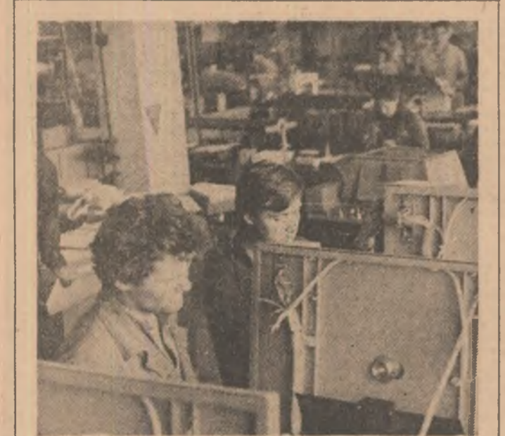
DIN CRONICA ÎNTRECERII

În centrul preocupărilor colectivelor de oameni ai muncii — îndeplinirea integrală a tuturor indicatelor de plan