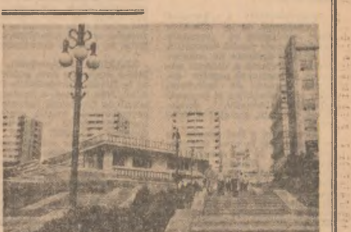
Noul peisaj urbanistic al municipiului Slătina