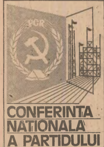
CONFERINȚA NAȚIONALĂ A PARTIDULUI

ORGAN AL COMITETULUI CENTRAL AL UNIUNII TINERETULUI COMUNIST