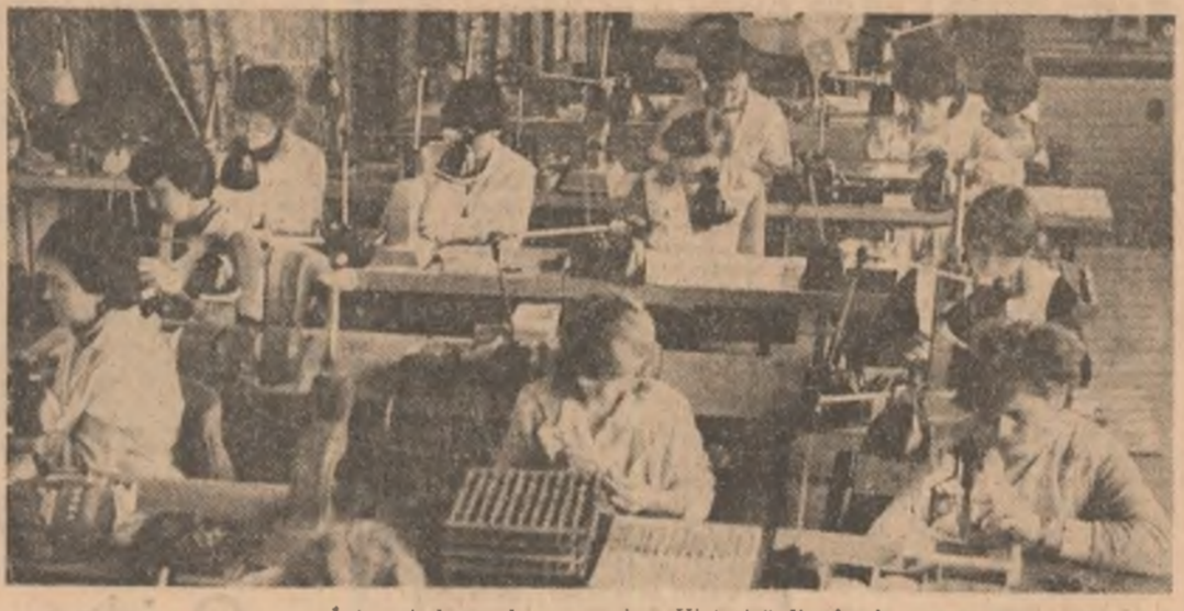
Întreprinderea de casarmice „Victoria” din Arad