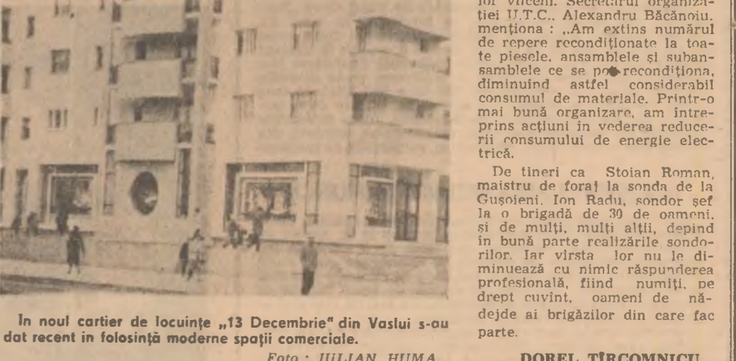
În noul cartier de locuințe „13 Decembrie” din Vaslui s-au dotat recent în folosiță moderne spații comerciale.