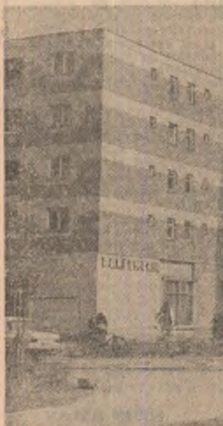
Giurgiu — un oraș înscris pe coordonatele moderne ale urbanismului contemporan

Puțină aducere aminte e necesară cînd vorbim despre Bu-huși, chiar dacă n-oi să le vedem minte arhitectonică, (eleganță și bun gust pe toate liniile) nu au nimic de-a face cu sentimenta-lismul privirii retrospective, a gîndului întors, fie și o clipă, spre trecut. Au mai rămas să-l evoc două-trei străzi și alte câteva case... Imaginea vechiului oraș s-a păstrat doar în amintirea locuitorilor, estompuindu-se rapid și sigur în ritmul accelerat al noilor construcții. Uitate își continuă omeneșul său joc, în timp ce orașul propriu-zis și-a păstrat deja marea sa străveche ce însoțea o bună bucată de drum Căminului și Calea Bacăului, urcînd panta dealului din apropiere, spirălat și statornic precum cochilia unui melc. Pînă nu demult, întreaga așezare se concentra în jurul Fabricii de postav, altcumva renumită nu doar prin vechimea ei datată, dar și prin frumusețea-etaon a harnicilor sale muncitorești. Lipsit de alte resurse naturale și tradiția unei ambiții culturale, dezavantajat de apropierea de cele două mari orașe din zonă, Bu-hușii era