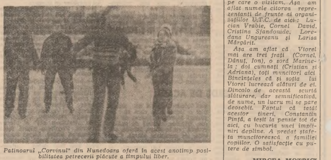
Patinoarul „Corvinul” din Hunedoara oferă în acest anotimp posibilitatea petrecerii plăcute a timpului liber.