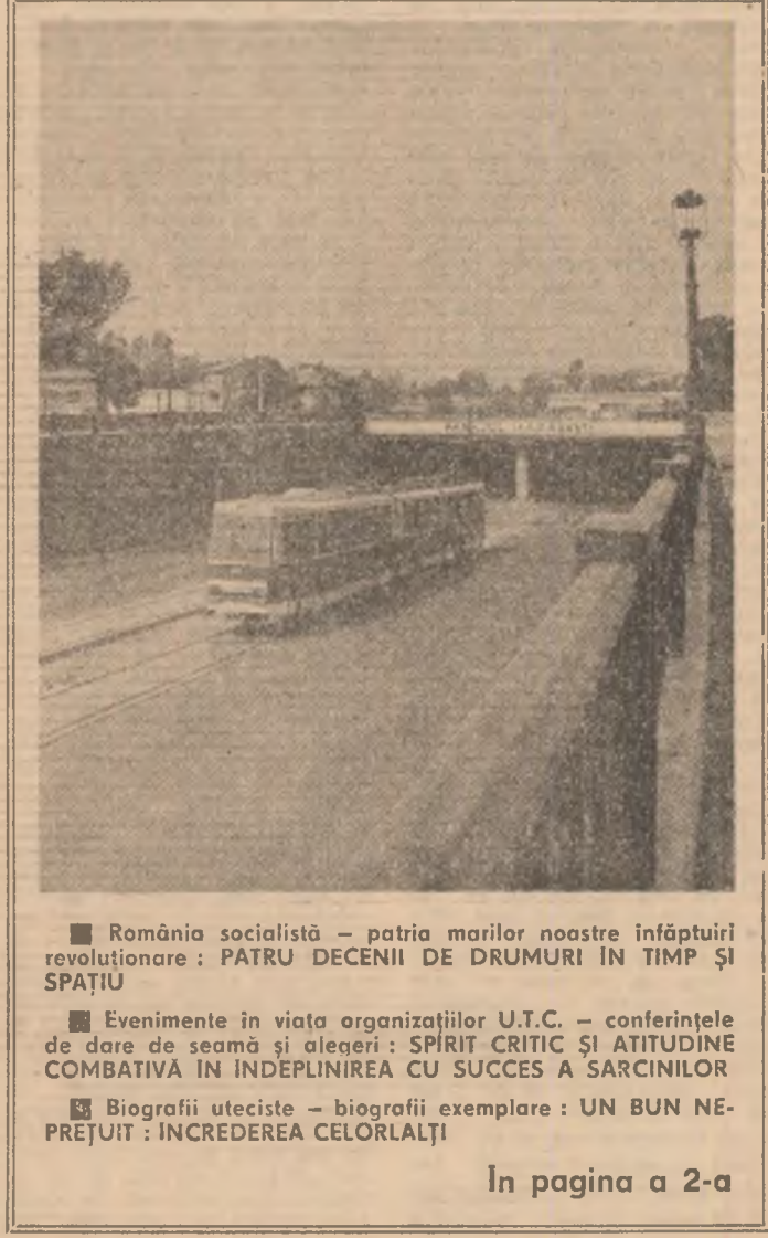
România socialistă — patria marilor noastre împliniri revoluționare: PATRU DECENII DE DRUMURI ÎN TIMP ȘI SPAȚIU Evenimente în viața organizațiilor U.T.C. — conferințele de dare de seamă și alegeri: SPIRIT CRITIC ȘI ATITUDINE COMBATIVĂ ÎN ÎNDEPLINIREA CU SUCCES A SARCINILOR Biografiile uteciste — biografii exemplare: UN BUN NEPREȚUIT: ÎNCREDEREA CELORLALȚI În pagina a 2-a

Manifestări politico-educative și cultural-artistice dedicate aniversării Republicii În pagina a 3-a