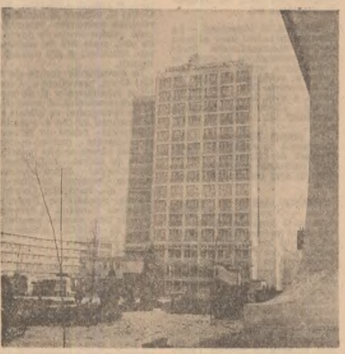
Pe masura traditiei sale turistice, Sibiu cunoaste o puternica dezvoltare a bazei materiale in acest domeniu

Luni, 28 decembrie, la sediul C.C. al U.T.C. a avut loc, in cadrul unei festivitati, inmanarea Diplomei de Onoare a Comitetului Central al Uniunii Tineretului Comunist cistigatorilor la etapele pe care le-au parcurs concursurilor profesionale si olimpiadelor pe meserii, precum si al concursului de creatie tehnico-stiintifica pentru tineret in anul 1987.