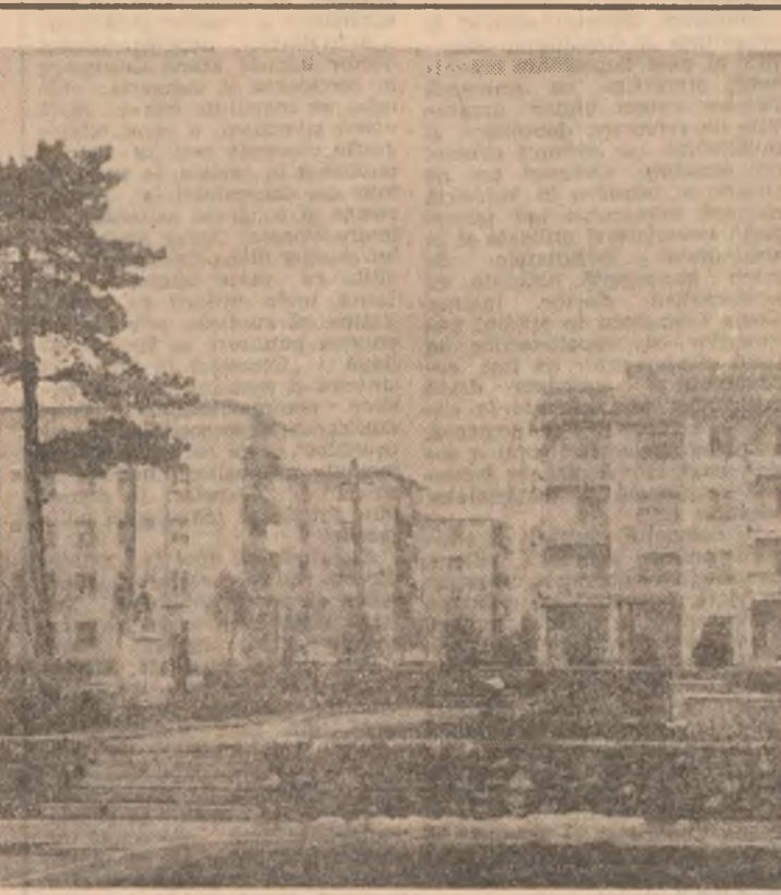
Videle — un oraș al petrolistilor teleormăneni — a cunoscut o modernă dezvoltare urbanistică

La Clubul Intreprinderilor „23 August” a avut loc o amplă dezbateri cu tema „Raportul tinarilor Nicolae Ceaușescu prezentat la Conferința Națională a partidului și programul marelui partid pentru anul 1988”.