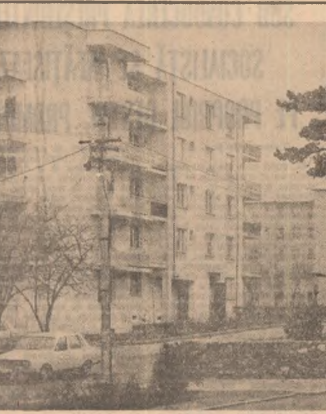
Videle — un oraș al petrolistilor teleormăneni — a cunoscut o modernă dezvoltare urbanistică

La Clubul Intreprinderilor „23 August” a avut loc o amplă dezbateri cu tema „Raportul tinarilor Nicolae Ceaușescu prezentat la Conferința Națională a partidului și programul marelui partid pentru anul 1988”.