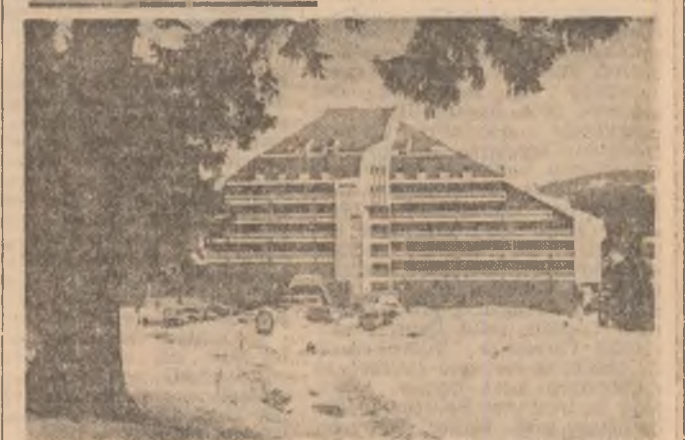
Invitație la Predeal