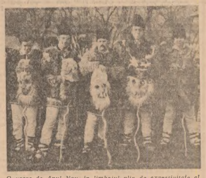
O urare de Anul Nou, în limbajul plin de expresivitate al străbunilor măști populare