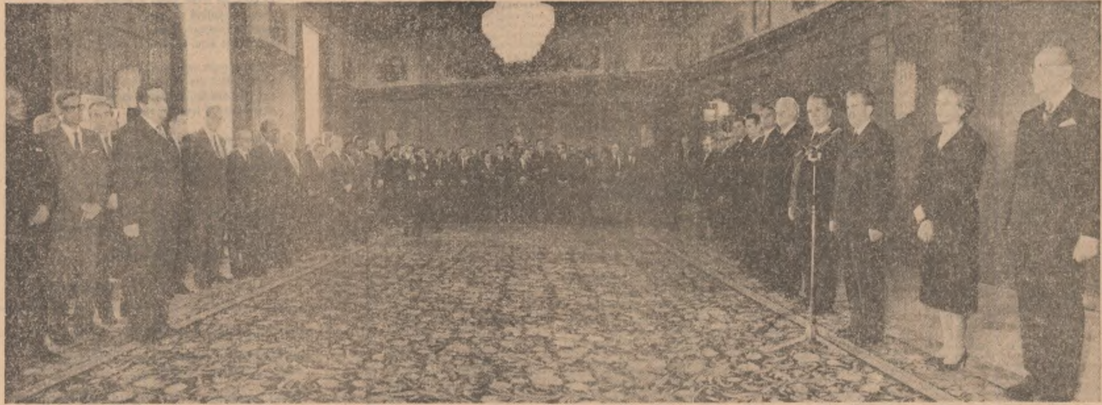
Națională. De aceea, nu mă refer la toate acestea. Avem și o serie de rezultate bune, mai avem și greutăți și lipuri. Intrăm însă în anul noul cu hotărârea fermă de a lucra mai bine, de a obține rezultate mai bune în întreaga noastră dezvoltare economico-

În ce privește situația din România, ați trăit aici, cu noștrii și preocupările, și ceea ce aveți bun și ceea ce aveți rău. De altfel, în ultimele săptămâni am dezbătut pe larg problemele acestea în organismele noastre democratice, începând cu Conferința Națională a partidului și sfârșind cu Marea Adunare