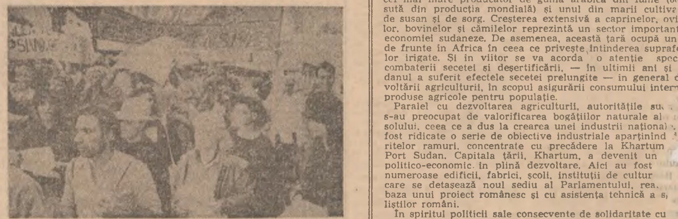
AUSTRALIA — Demonstrație a studenților desfășurată la Melbourne împotriva creșterii taxelor universitare

● ÎN TRECUTA săptămînă astronomice respective, apreciindu-se că această conlucrare ar trebui extinsă asupra tuturor domeniilor legate de cercetarea spațiului extraterestru. Totodată, „Asahi” consideră că în anul 1987 știința nu a reușit să obțină succese importante în direcția cercetării unor probleme globale, inclusiv oprirea degradării stratului de ozon care înconjoară planeta noastră.