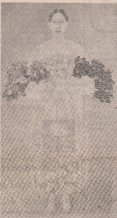
ELENA GRECULESEI — „Pace“