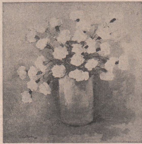
GHEORGHE CRISTACHE — Sentiment