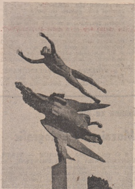
„Omul și pegasul“ — sculptură în bronz de Carl Milles, unul din cei mai mari sculptori ai Suediei

Toată seara aceea el n-au avut ochi și urechi decit unul pentru celălalt. Au mîncat, au băut, au dansat și au discutat amindoi gîndindu-se așa cum se gîndesc îndrăgostii cind nu sint singuri, ce ar face ei dacă ar fi singuri!