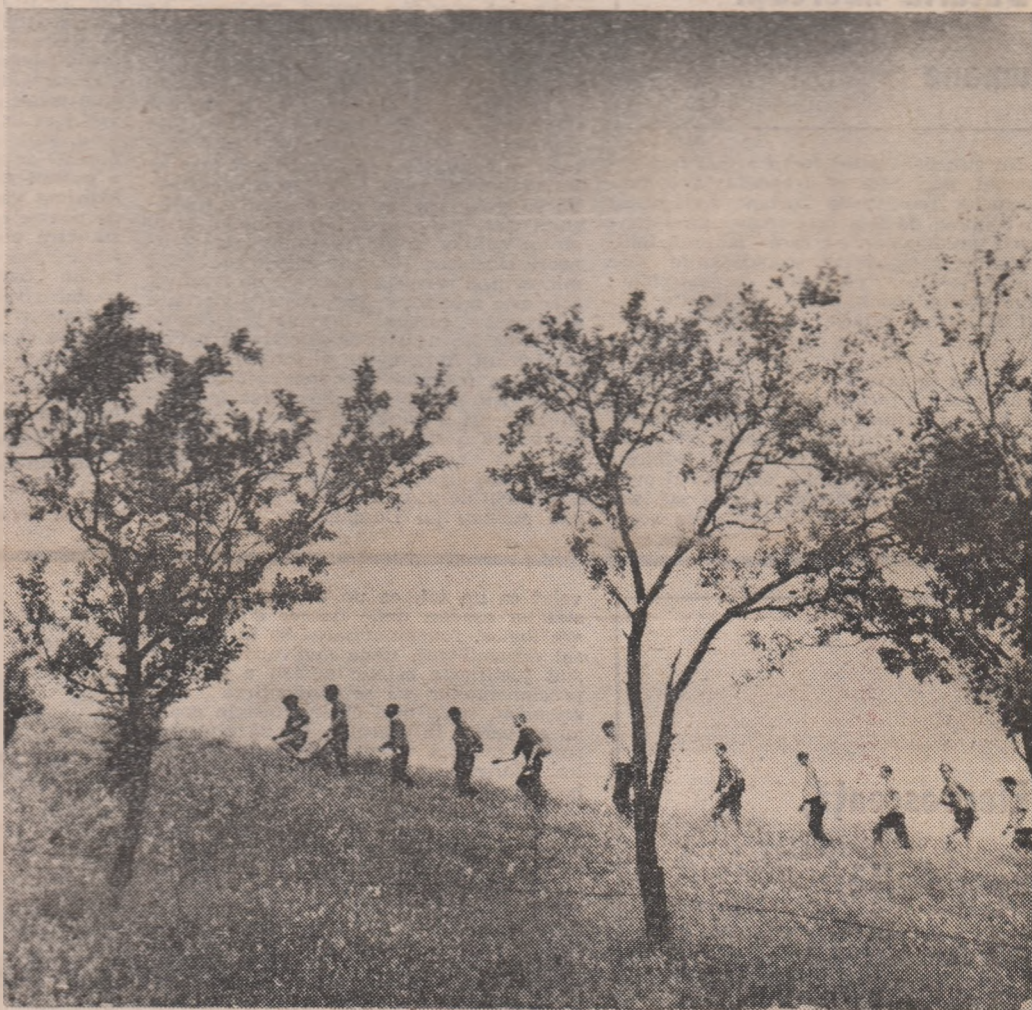
E vremea excursiilor la iarbă verde