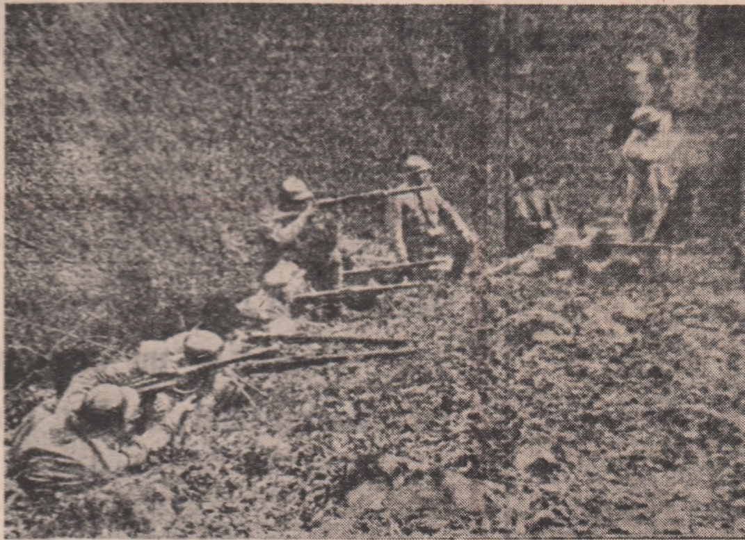
Soldații regimentului „Stefan cel Mare” ur_mărînd pe inamie în bătălia de la Mărășești

Armatei a IX-a, raporta felmaresalului Mackensen: „Luptele care au avut loc între 25 iulie și 6 august au dovedit că presupunerile și speranțele că rușii și românii se vor retrage fără rezistență, sau că se vor lăsa a fi făcuți prizonieri, au fost o eroare. Din contră, armatele ruso-române s-au bătut vitejește și fiecare șanț, fiecare casă, fiecare înălțime au fost apărate vitejește... Contraatacurile au fost bine conduse și cele mai multe au ajuns la lupte corp la corp. Numai contra Corpului 1 armată rezervă s-au executat de la 25 iulie — 6 august circa 60 de contraatacuri mai mari”.