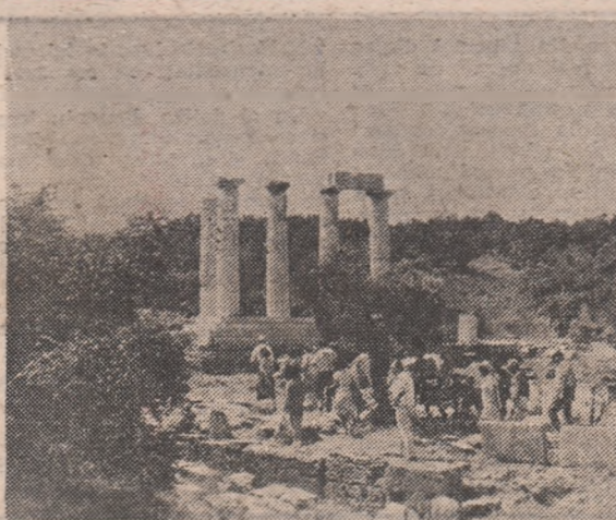
Ruinele Sanctuarului Marilor Zei din insula Somatragi, din nordul Mării Egee

Astfel pe virful picioarelor stînd, te-am privit pină ochii de plîns și scintei s-au îndestulat și mi-am simțit rădăcinile cum se desprind și pogoară în al Tatălui Duh preocupat.