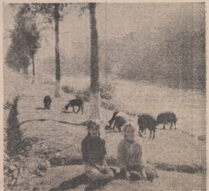
O vale „a frumoasei”: valea Sucevei, la Brodina IN PAGINILE 6-7: File din jurnalul de călătorie al tinărului scriitor: TURNEUL CENACLULUI „CONFLUENȚE” ÎN JUDEȚUL SUCEAVA