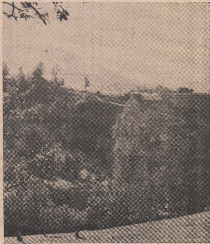
Pe drumul de costișe...