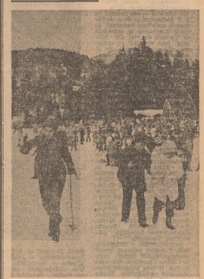
Inițiativă pe pista de șchi