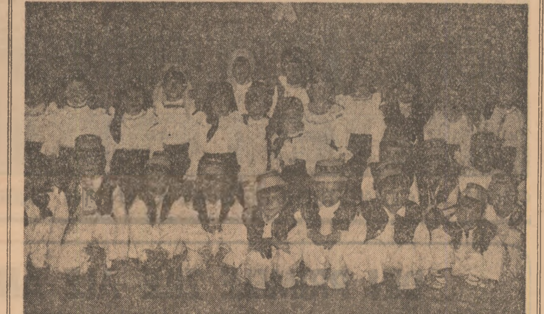
Copii frumoși și sănătoși pentru vigoarea și tinerețea patriei