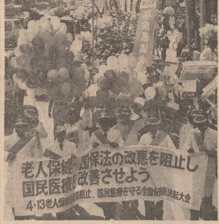
Reprezentanți ai corpului medical japonez, în timpul unei demonstrații ce a avut loc la Tokio pentru îmbunătățirea asistenței sanitare

Anterior, președintele în exercițiu al Consiliului a desfășurat ample consultări cu reprezentanții statelor membre ale acestui organism în vederea armonizării pozițiilor lor în problema respectivă.