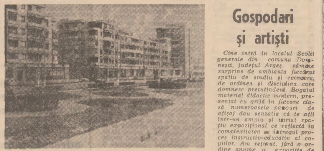
Galați: Noi construcții în zona portului