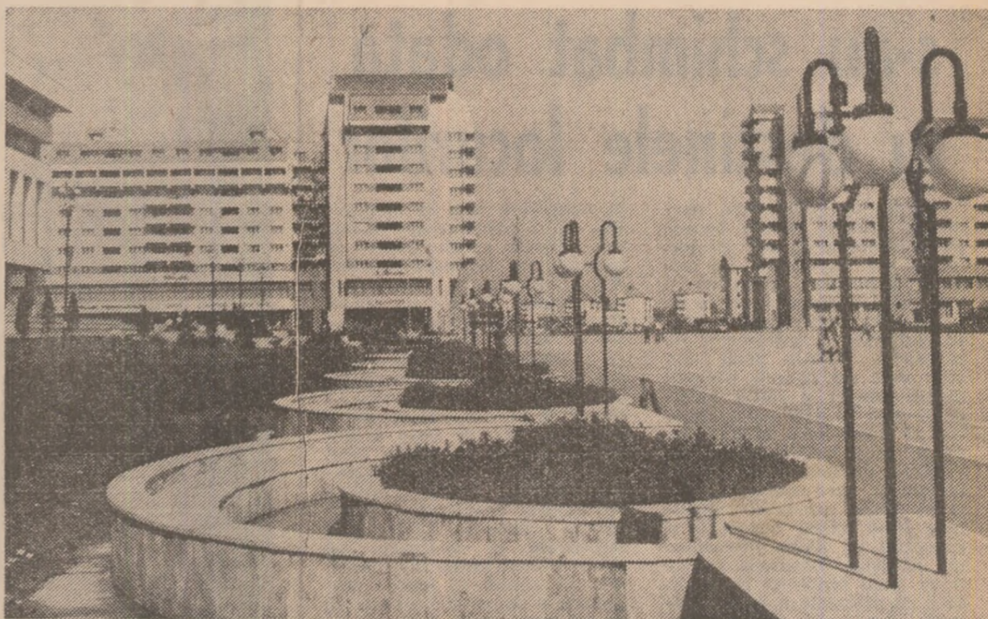
Suplete arhitectonică la Miercurea Ciuc