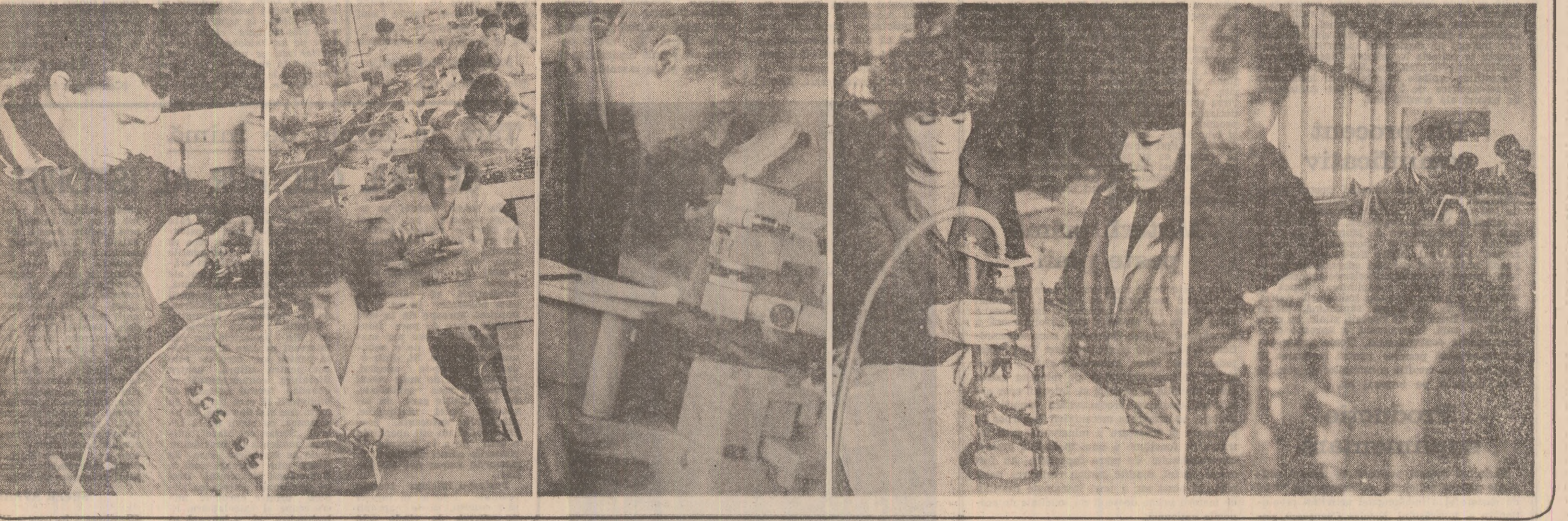
Pagină realizată de CONSTANTIN STAN, FLORENTA MARDALE, SORIN OVIDIU BALAN

„Mi-e cam teamă!” Am primit o replică pe măsura răspunsului meu sincer: „Bine, atunci înseamnă că ai ceva în cap”. Și, lată că, din noiembrie 1980, funcția de director tehnic ridică numeroase probleme în fața mea, dar