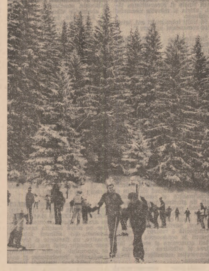
Vis cu zăpadă la Poiana Brașov

jurile magice ale naturii. Privind manuscrisul Fratilor Jderi sau cel al Tării de dincolo de neagră, te umpli, în aceeași măsură de cioc și de înaltătoare tiniste profund purificatoare. Te afli teribil de aproape de eternitate. Print-o rază a dimineții care străbate cristalin prin ferestre, poți contempla complexul arhitectonic început încă în vremea lui Alexandru cel Bun și desăvîrșit de mesterii lui Ștefan cel Mare.