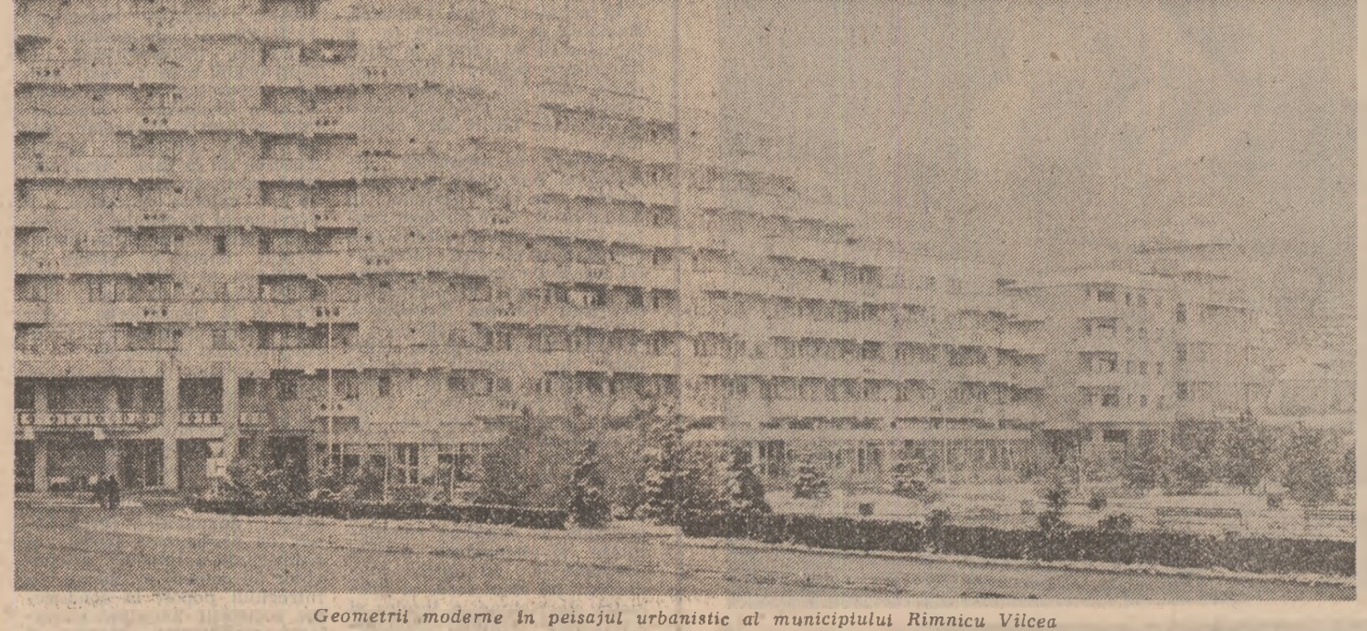
Geometrii moderne în peisajul urbanistic al municipiului Rimnicu Vilcea

Liceul industrial „Stephan Ludwig Roth” are două profiluri — electrotehnic și mecanic —, reunind 610 elevi la cursul de zi (în afara celui seral și a școlii profesionale), pregătind forță de muncă specializată pentru numeroasele întreprinderi ale municipiului Medias sau pentru județ. Și, fiindcă întîmteam mai înainte de nivelul deosebit de pregătire al elevilor, o singură cifră de dată recentă va înlocui un șir lung de alte exemple: la sfîrșitul trimestrului I, la clasa a IX-a A, din 36 de elevi, 20 au avut la matematică medii peste 9,10 iar nici unul dintre ceilalți nu au avut sub 8. Acest obiect de studiu, atît de dificil pentru alții, este datorită unor profesori dăruți cu harul predării și unui nestîvîlit entuziasm, cel care le asigură elevilor din acest liceu un examen fără „dureri de cap” la treapta a II-a, dar și o tr-