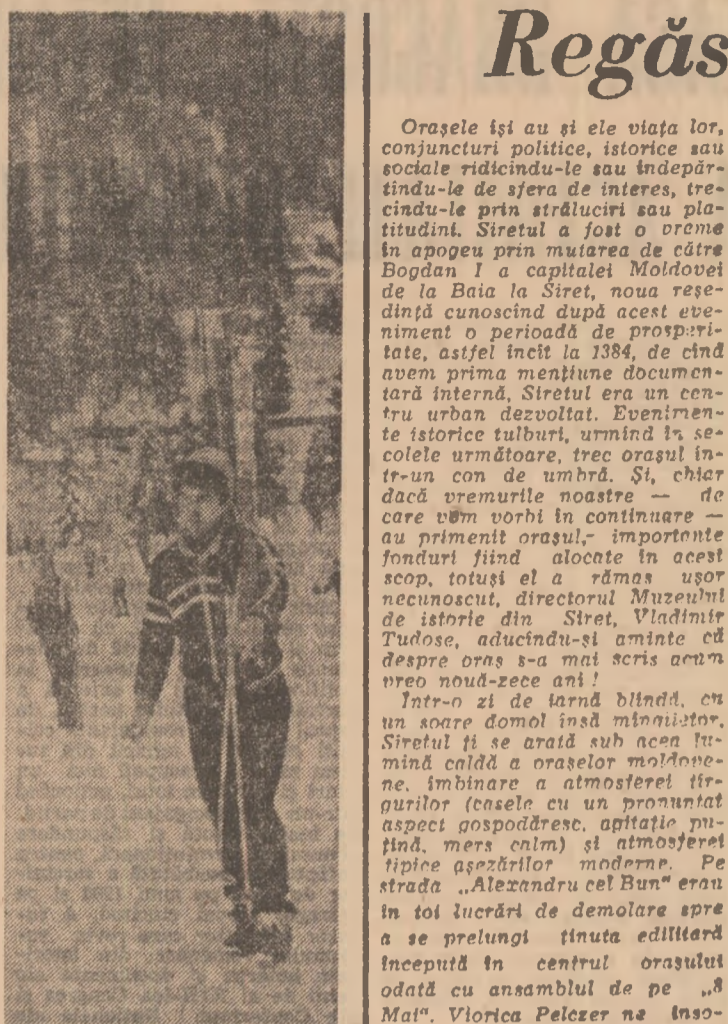
Activitate de sezon: schiul