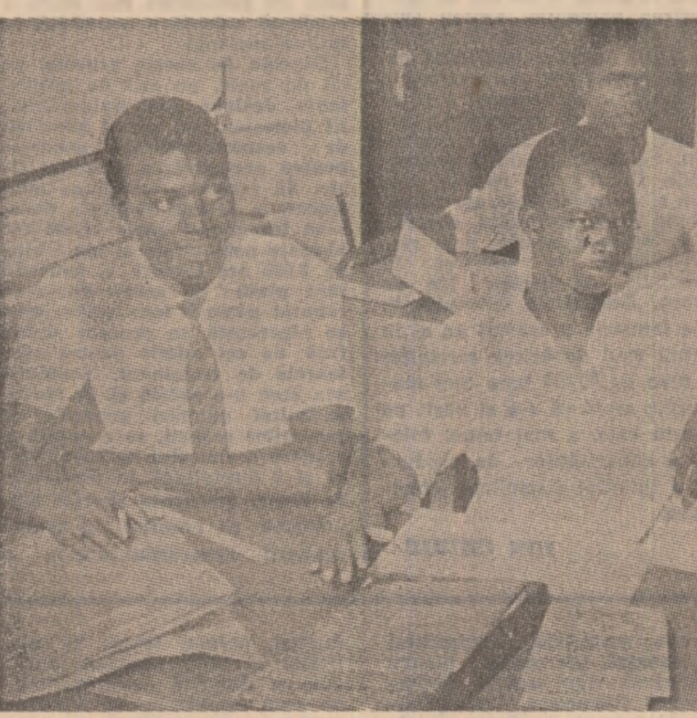
NIGERIA — Studenți ai Universității din Lagos, capitala țării, la o oră de curs

ROMA 4 (Agerpres). — În cadrul dezbaterilor care au loc în Parlamentul italian, guvernul Giovanni Goria a fost de două ori pus în inferioritate la votarea în Camera Deputaților a proiectului legii finanțării ANSA și TASS, la început deputatul au aprobat un amendament propus de partidele de stînga, care prevede măsuri în vederea reducerii somajului în rândurile tineretului. Apoi, deputatul au respins din proiectul de lege guvernamental punctul