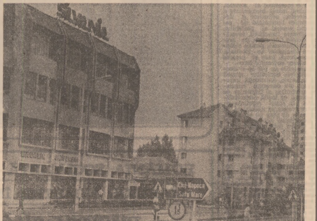
Arhitectură nouă în Zalău.

(Urmare din pag. 1) sabite. Mulți, foarte mulți tineri școlii la Cluj-Napoca, Oradea, Timișoara, Iași s-au întors cu toată dragostea pe locurile natală, sărbătorind aici, „armata“ de specialiști pe care se bazează modernă industrie sălăjeană. Nu numai Zalău a beneficiat de o astfel de specialitați devenire, ci și celelalte localități: Zibonca, Cehu Silvaniei, Sîmleu Silvaniei, Someș Odorhei unde s-au construit întreprinderi sau secții mari ale întreprinderilor din Zalău. Desigur că odată cu dezvoltarea industrială și aspectul acestor așezări s-a schimbat fundamental. În privința comparațiilor cu anul înfăptuirii județului sălăjean, în singur orașul Zalău este azi de 60 de ori mai puternic decât în urmă cu douăzeci de ani, el realizînd în numai 13 zile întreaga producție industrială a anului 1987!