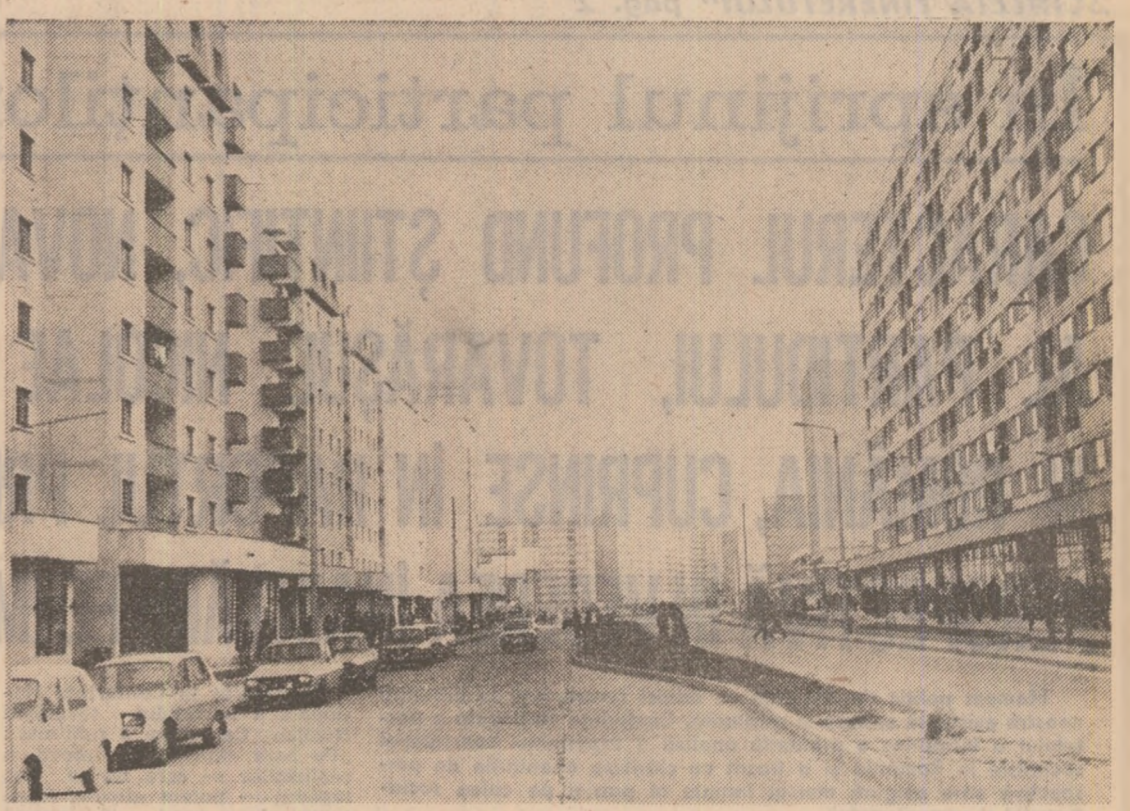
Reșita — însemne ale noului și ale civilizației moderne

ANUL XLIV SERIA II Nr. 12 045 6 PAGINI 50 BANI MIERCURI 24 FEBRUARIE 1988