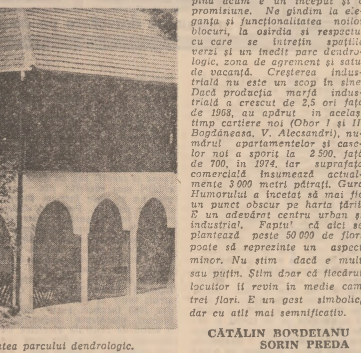
Imagini ale noilor blocuri de locuințe și ale viitorului centru civic. Complexul turistic și de agrement „Arșița” situat în vecinătatea parcului dendrologic. CATALIN BORDEANU, SORIN PREDA