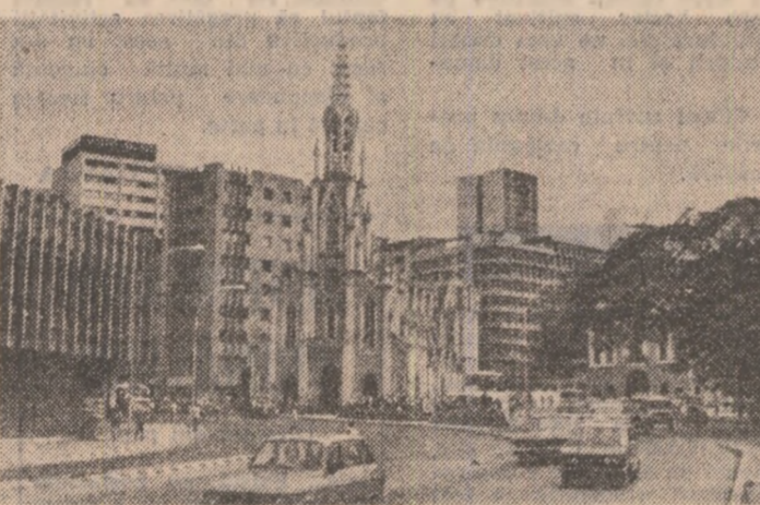
Imagine din Cali, unul dintre cele mai vechi orașe din Columbia