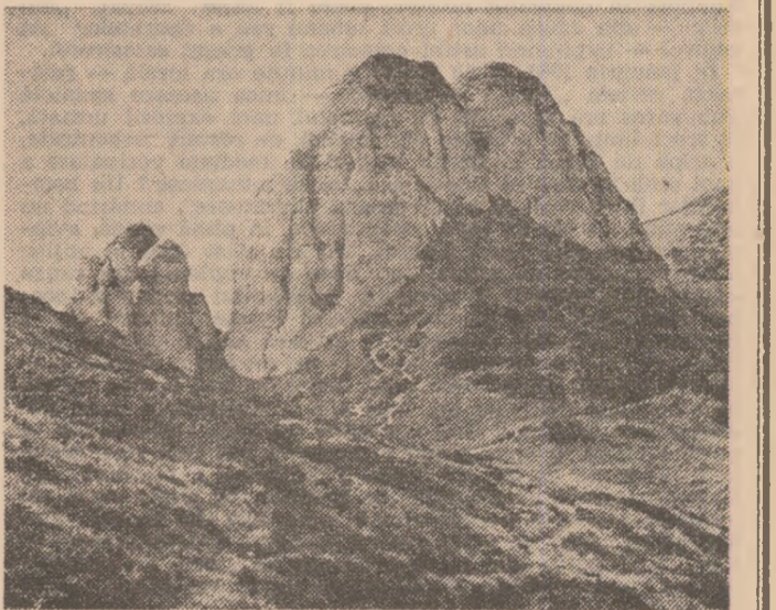
Ciucasul... fără zăpadă