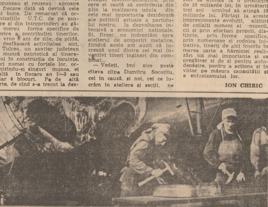
Lucrînd ca pe roate la vîltoare roșii...