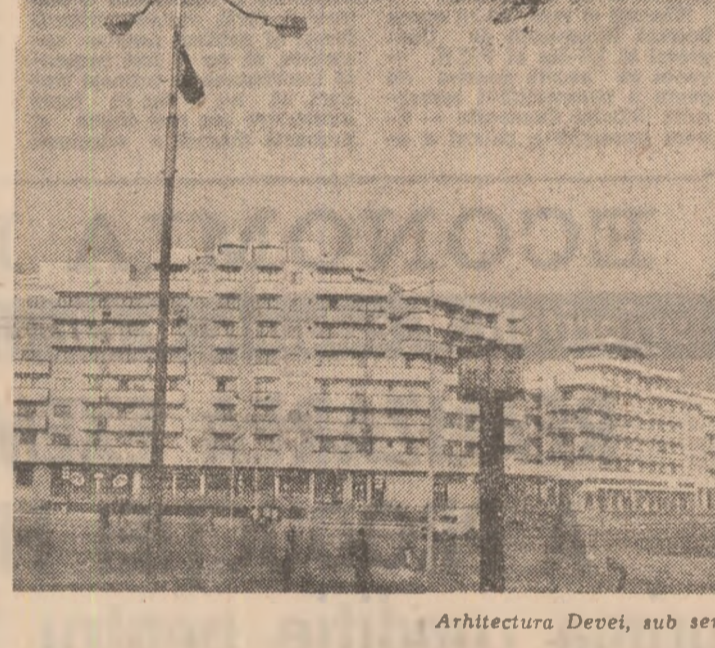
Arhitectura Devei, sub semnul lumini și al armoniei