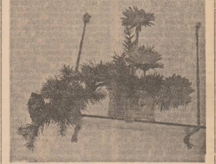
Aranjament floral I