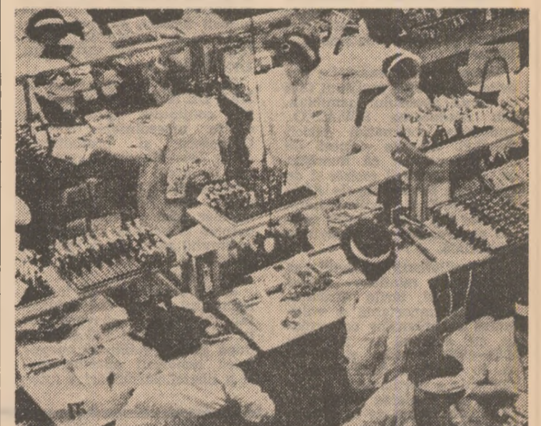
„Tehnolon” — o marcă de prestigiu pentru industria electronică din municipiul Iași.

Dezvoltarea rapidă a potențialului economic și socio-cultural s-a reflectat pozitiv în sporirea substanțială a bunăstării materiale și spirituale a populației, în creșterea continuă a calității vieții. Împădîntul și știință dispun de dotări moderne pentru cercetare și micro-producție, o veritabilă platformă politehnică ridicîndu-se pe malul stîng al Buzului, cîtorie a învîdămîntului superior românesc care își aduce o contribuție de seamă la formarea tinerii generații și în desfășurarea muncii creatoare a unui