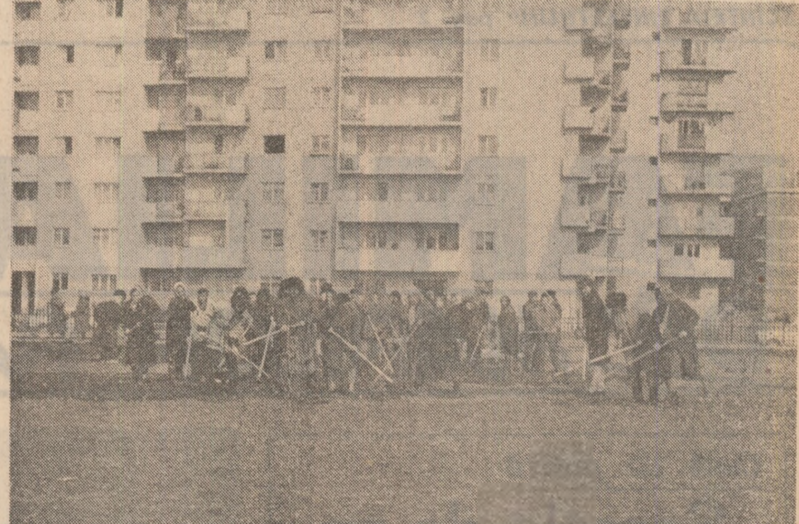
Ieri, duminică, mii de tineri din toate județele și localitățile patriei au participat la ample acțiuni de înfrumusețare și de plantare a pomilor în cadrul programelor stabilite pentru „Luna pădurii” (în pagina a V-a: „Șantierul faptei ucestice”).