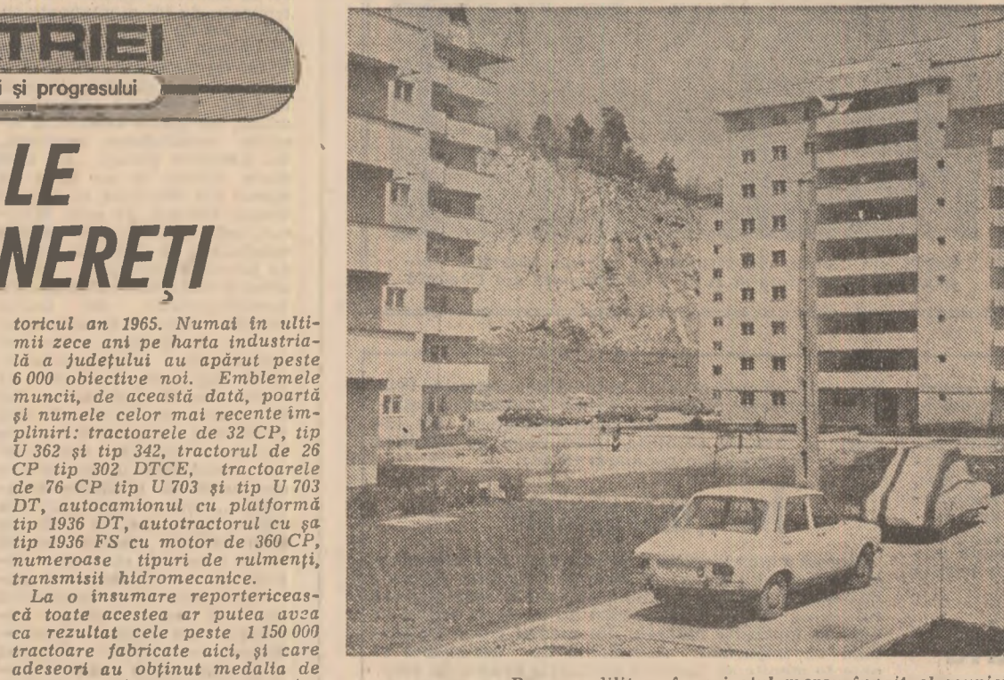
Repere edificare în peisajul mereu înnoit al municipiului Brașov

a noi capacități, a noi unități productive, în care, să afirmăm Comitetul de Stat al Hîrghez, „Hidromecanic” II, secția de cușineti „Rulmentul”, secția de echipament electrico-auto „Electroprecizia”, unitatea a II-a a întreprinderii de scule Rîmnic, instalațiile de metal, formele plastice de la Combinatul chimic Orășul Victoria. Se impune să arătăm că județul Brașov dispune de fonduri fixe în valoare de peste 102 miliarde lei din care peste 80 la sută au fost puse în funcțiune după is-