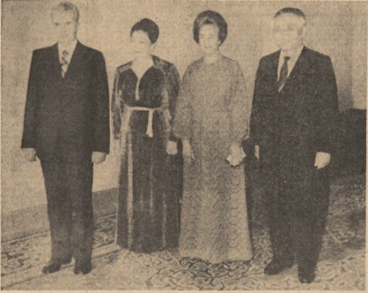
(În pagina a 3-a)

Tovarășul Nicolae Ceaușescu, secretar general al Partidului Comunist Român, președintele Republicii Socialiste România, răspundând întrebărilor unor corespondenți de presă, a făcut, înaintea plecării din Hanoi, următoarea declarație: Vizita în Vietnam s-a încheiat cu rezultate foarte bune. Am discutat un cerc larg de probleme, inclusiv problema soluționării politice a situației din Kampuchea pe calea reconcilierii naționale, a asigurării independente, suveranității și caracterului de tară nealiniată al Kampuchiei și, totodată, să se ajungă la retragerea trupelor vietnameze și la încetarea oricărui amestec din afară în treburile interne ale Kampuchiei. Considerăm că aceasta răspunde intereselor tuturor popoarelor din Indochina, tuturor popoarelor din această zonă.