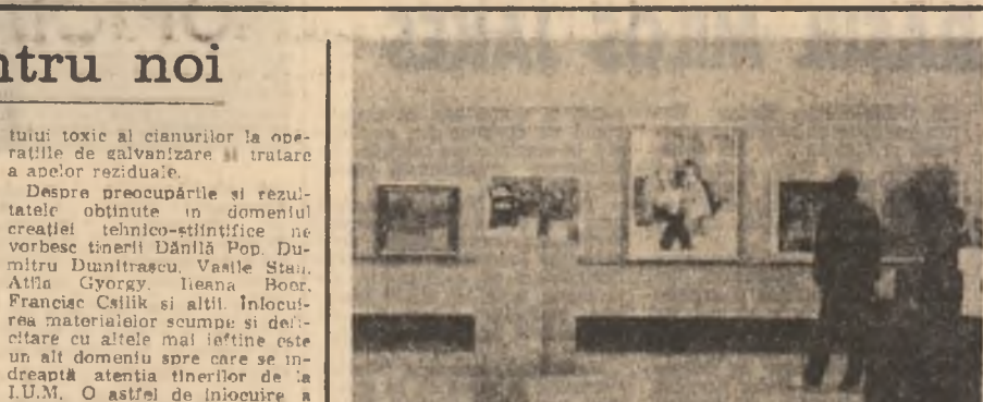
Evenala de pictură și sculptură — '88 găzduțată la Sala Dalles