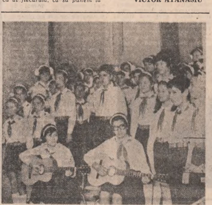
Cele mai tineri vîrstare ale țării cîntă patria și partidul

munca poate să treabă să devină înalt productiv — ne relatea interlocutorul, în intenția de a da un răspuns cit mai complet întrebării reporterului. Aceasta însemna, în primul rînd, să ne rezervăm posibilitățile, să descoperim noi căi pentru eficientizarea activității productive. Si analiza s-a dovedit a fi rodnică: bunăoară, la instalarea de hidrosulfuri (diluții de sodiu) s-au adus o serie de îmbunătățiri fluxului tehnologic, fiind reamplasate mai judicios unele utilaje, fiind în măsură să prelucram integral toate materialele prime cu care sîntem aprovizionat. Arătăm produsul, hidrosulfur, este mult solicitat de către economia națională, avînd utilizări în industria usoră, respectiv pentru vopsirea unor fibre, în industria zahărului etc. Dar această analiză s-a materializat și sub un alt aspect, deloc neînsemnat: desul tehnologic, rezultat în cadrul instalat este valorificat, obținîndu-se oxid de zinc — material deficitar, după cum se cu-