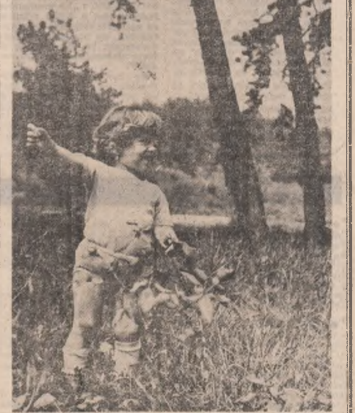
Primăvara copilăriei