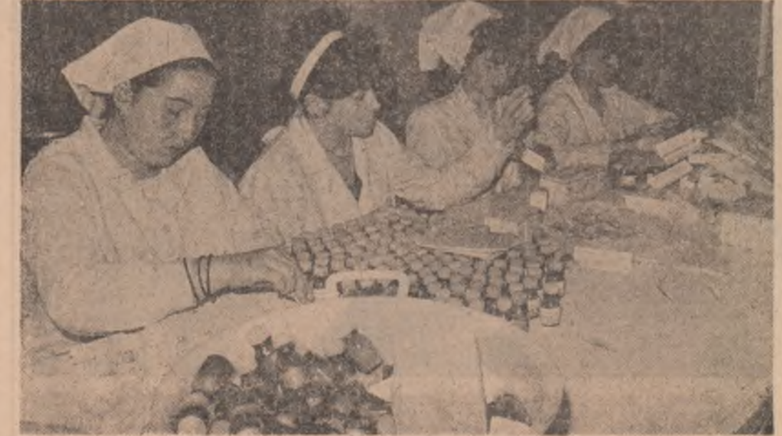
Practica productivă a elevilor de la Liceul ind. nr. 5 București