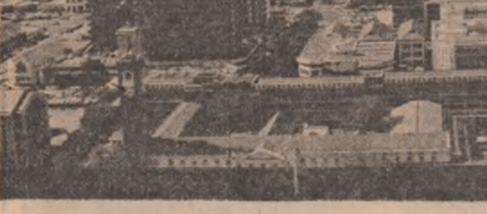
Construcții moderne în capitala Kenyei, orașul Nairobi

LIMA 16 (Agerpres) - În capitala Perului se desfășoară lucrările unei conferințe consacrate examinării problemelor dezarmării regionale. În cadrul dezbaterilor s-a subliniat necesitatea reducerii cheltuielilor destinate înarmării și folosirea mijloacelor financiare astfel eliberate pentru dezvoltarea economică a Americii Latine.