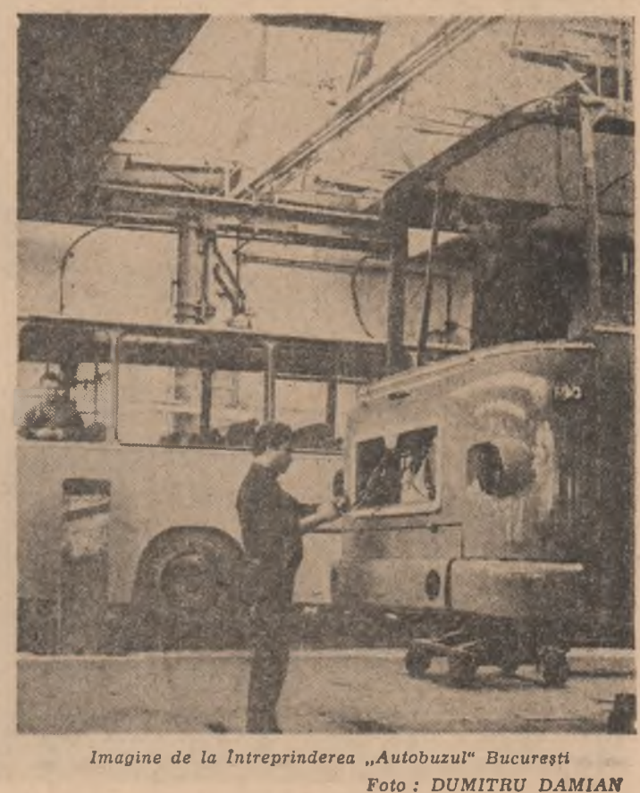
Imagine de la întreprinderea „Autobuzul” București