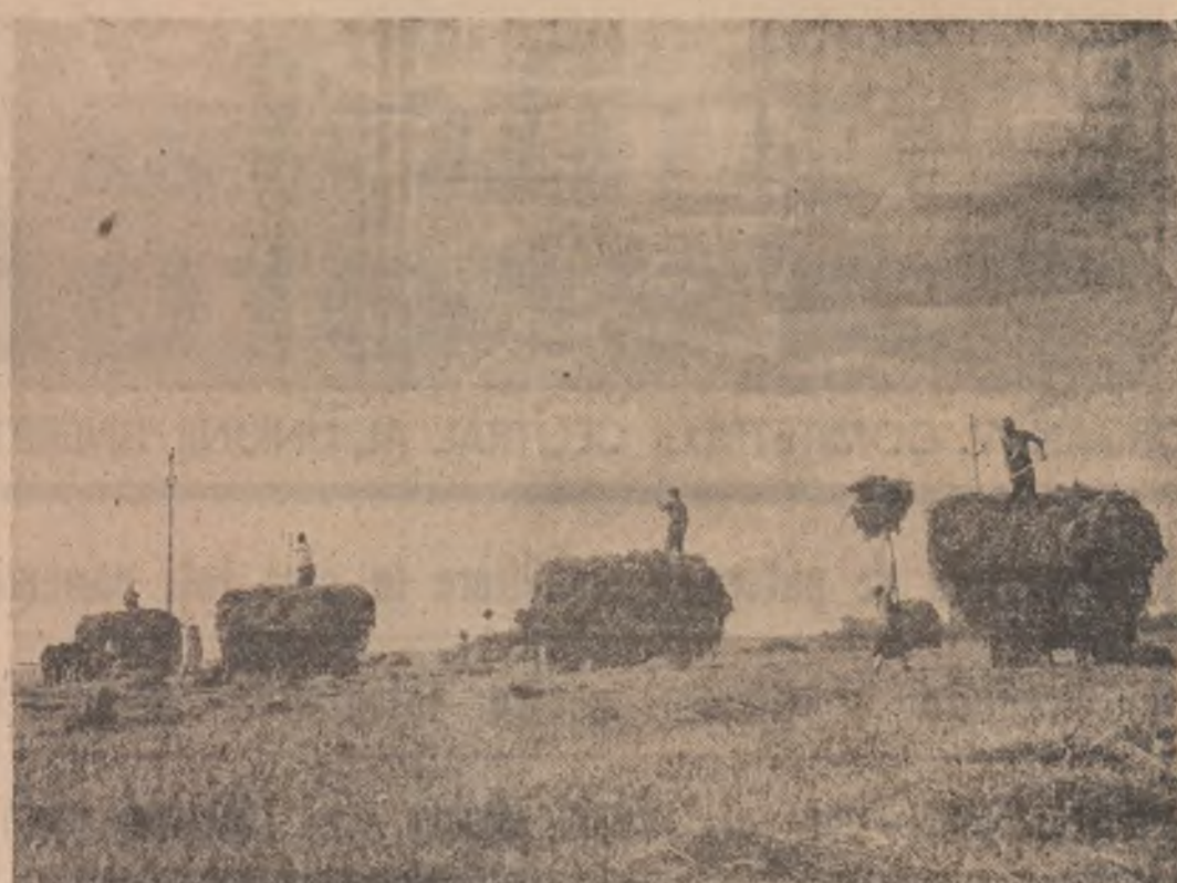
Stringerea și depozitarea furajelor, o importantă acțiune de sezon pe ogoare