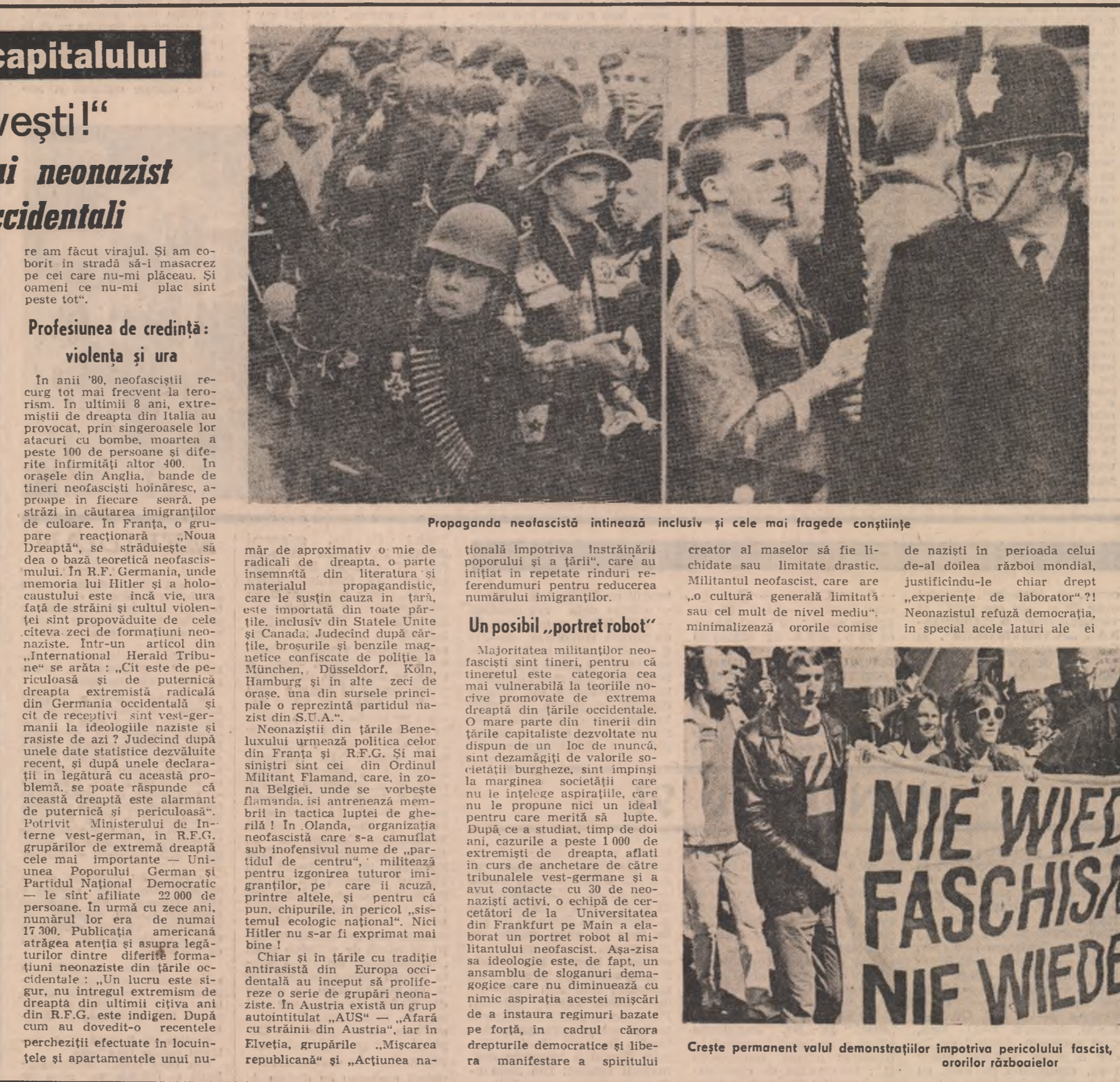
Propaganda neofascistă întonează inclusiv și cele mai fragede conștiințe

● ODATĂ cu atingerea cotei de 235 de metri, s-au încheiat lucrările la construcția corpului noului turn de televiziune din capitala Indiei. În prezent a început montarea echipamentelor. Noul turn va asigura transmiterea în direct în condiții optime a programelor de televiziune la o distanță de 90 de kilometri, iar în condiții acceptabile pînă la 140 kilometri.