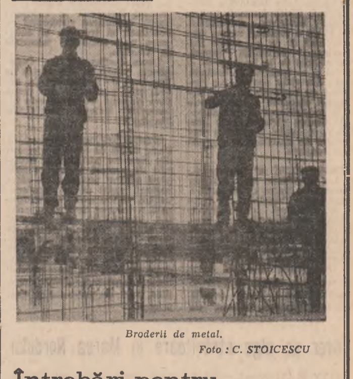
Broderii de metal.