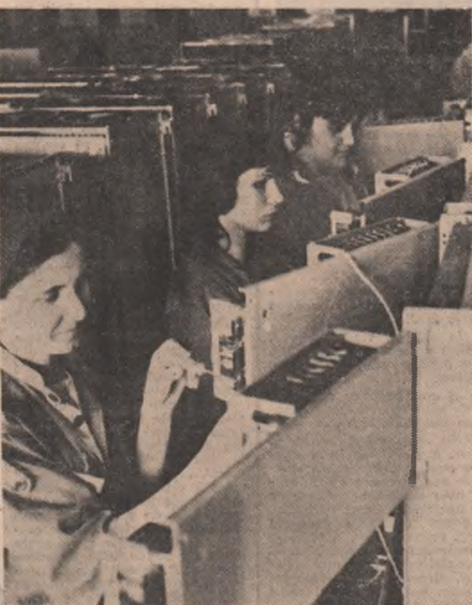
La Intreprinderea „Electronica” București

larg dezbătute, înfăptuite exemplar prin munca și viața tuturor fiilor patriei