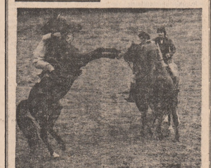
Și cîsi sint grațioși, nu-i așa?