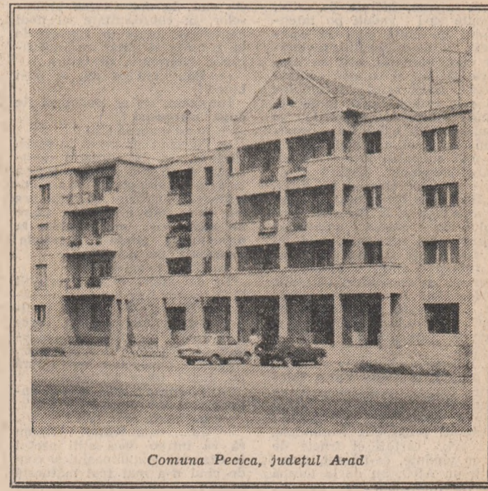
Comuna Pecica, județul Arad

IACOB FLOREA (Continuare în pag. a II-a)