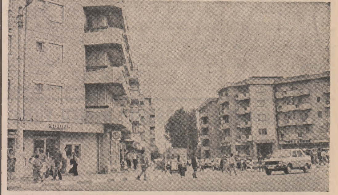
Imagine din Urziceni

D. I. DINCĂ (Continuare în pag. a III-a)