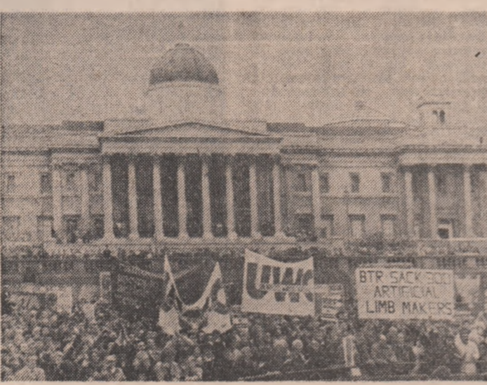
Marea Britanie — Demonstrație la Londra împotriva creșterii șomajului, în special a șomajului juvenil

BEIRUT 11 (Agerpres) — Un purtător oficial de cuvânt a anunțat — potrivit agenției E.F.E. — că, în Liban, vor avea loc alegeri prezidențiale, a-