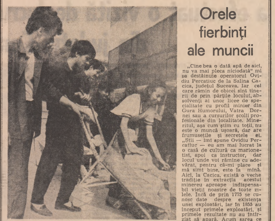
Zilnic, 40 de elevi ai Liceului Industrial din orașul Strehaia, județul Mehedinți, sînt prezente pe șantierul local... Într-un articol ce are ca temă exportul nu putem să nu ne referim la o seamă de preocupări organizatorice...