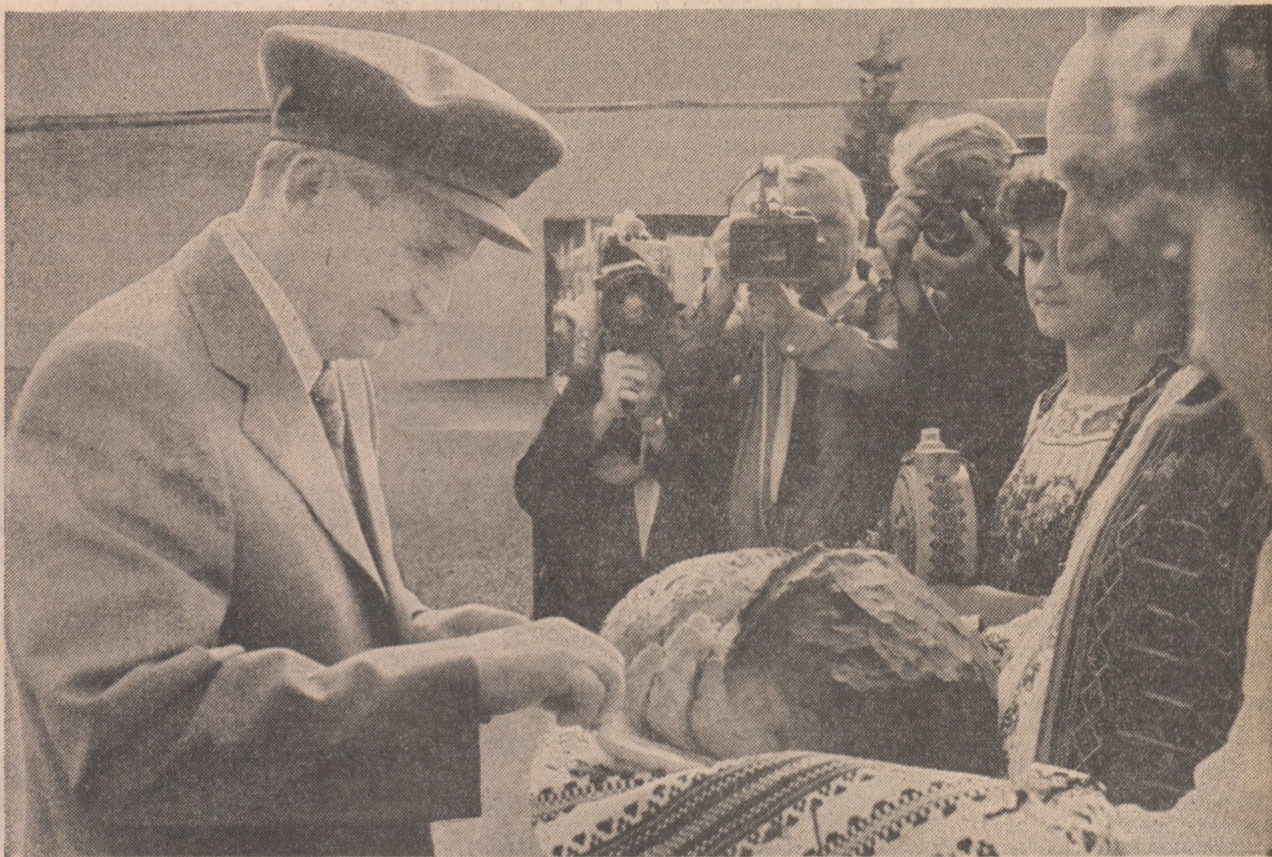
Tovarășul Nicolae Ceaușescu, secretar general al Partidului Comunist Român, președintele Republicii Socialiste România, a efectuat, simbătă, 27 august, o vizită de lucru în județul Arad.