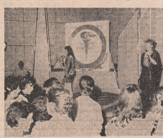
La „Modern-Club”, sub semnul generos al Festivalului național „Cîntarea României”