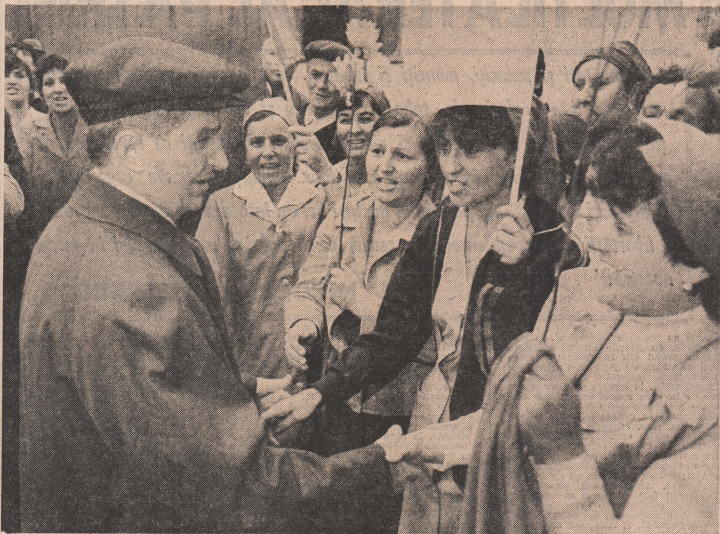
(Urmare din pag. a 11-a)

gru Lovrin 32, Lovrin 34, Lovrin 41, precum și hibridii simpli de porumb Lovrin 400 și Lovrin 390 au fost generalizați în agricultura întregii țări, aflându-se în cultură, anual, pe circa 1 milion de hectare. S-a arătat că stațiunea pune anual la dispoziția județelor o importantă cantitate de seminte cu valoare biologică ridicată, ceea ce oferă unităților cultivatoare garanția obținerii unor producții ridicate, în deplin acord cu cerințele și exigențele noii revoluții agrare.