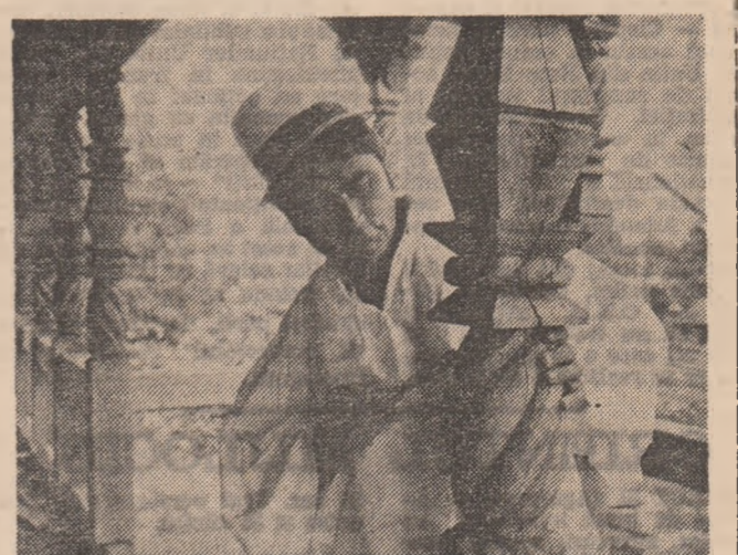
Forme în lumină