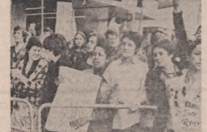
Tineri londonezi manifestînd împotriva șomajului, pentru crearea de noi locuri de muncă