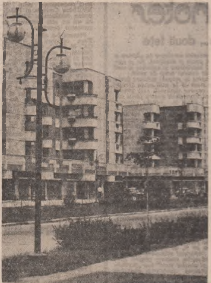
Slatina