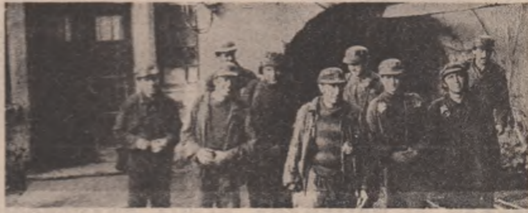
PRINCIPALUL EDUCATOR — MUNCA