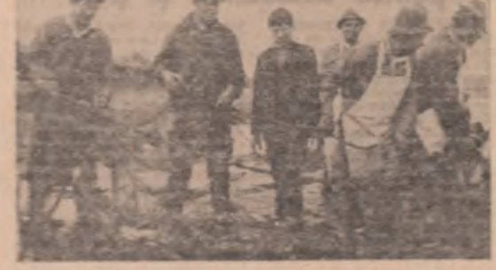
Pe scară din spate: Mănuşii, în timp ce lucrează în câmpul de cultură. În faţă: Mănuşii, în timp ce lucrează în câmpul de cultură. În faţă: Mănuşii, în timp ce lucrează în câmpul de cultură.

Dimineaţă, 27 de octombrie. Lumina era călătoare scurtoare. Cu nişte urse, plătite negre, botocile urseau, luate una de alta în larg. Se despriseră apoi învârtindu-se depărtându-se în câmpul aerului.