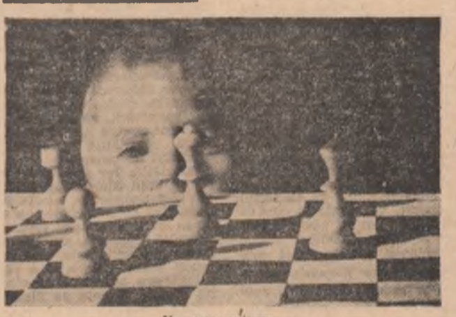
Un nou univers...