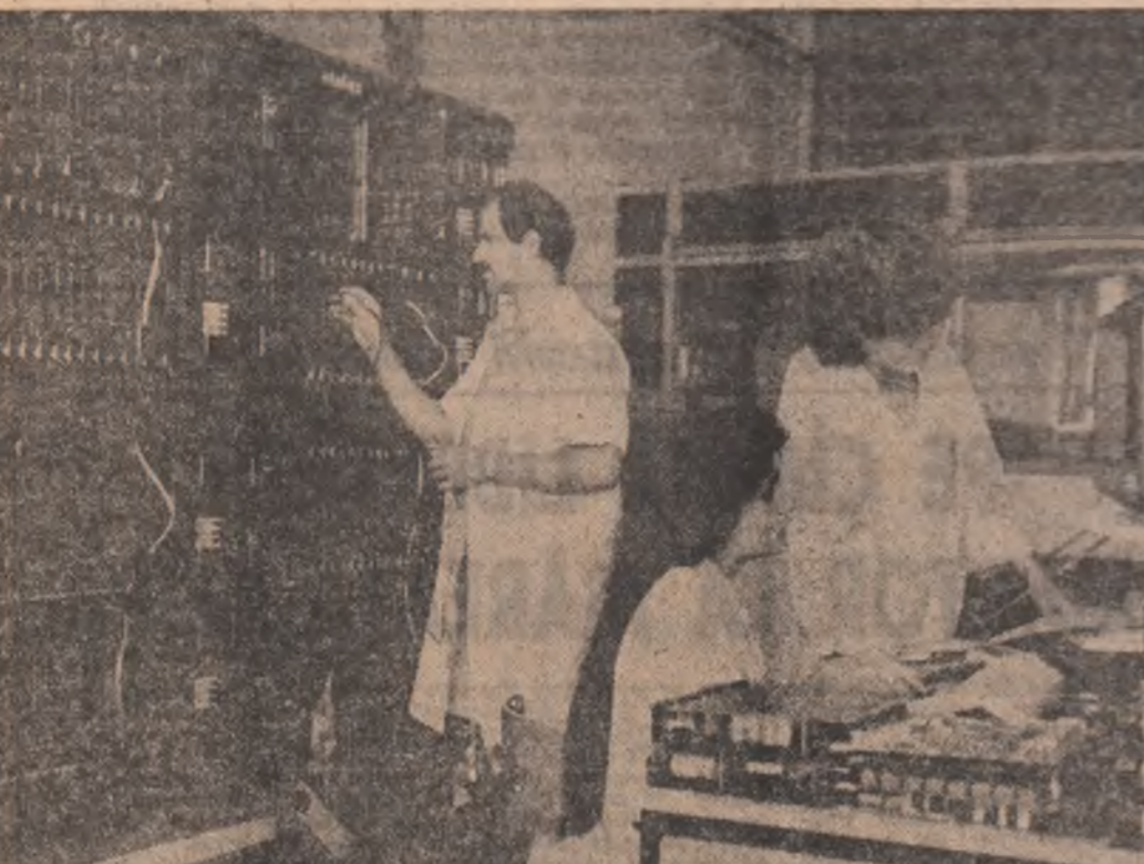
La Intreprinderea „Electromagnetica“ din București

stutiri pe această temă, de la pesteră omului primitiv, pînă la locuința dacică și casa țărănească românească. O reconstituire cu care ne mîndrim este cea a sanctuarului de la Partia — unicat în țară și aflat în corelație cu alte două sanctuare din lume, ceea ce demonstrează evoluția unitară a omului. Ca să revin la colaborarea cu elevii, ei au lucrat și la Partia, pe cînd se făceau săpăturile care aveau să scoată la lumină elementele ce au stat la baza reconstituirii sanctuarului neolitic, ei ne-au ajutat, reușind în cercun de „Prietenii arheologii“ și în alte zone: la Făget, unde s-a descoperit un tezaur medieval, la Pecu Nou unde am organizat un santier „de salvare“ (protejare) a unor descoperiri din perioada dacică. Tinerii au participat de asemenea la descoperiri care nun în lumină formarea poporului român. Valoarea economică a acestor participări (care nu este nici ea de neglijat) este cu totul pusă în umbră de valoarea