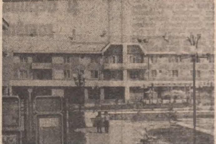
Centrala civică și comunei Nojorid, județul Bihor.