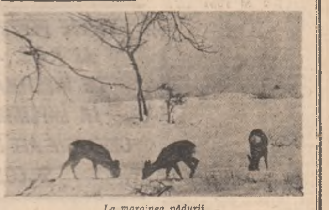
La marginea pădurii