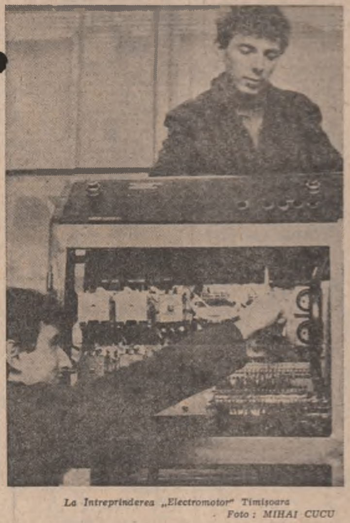
La întreprinderea „Electromotor” Timișoara