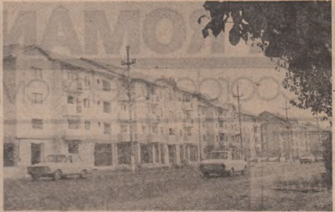
Arhitectură modernă în comuna Bragadiru

Nu numai domeniul profesional este urmărit cu foarte multă atenție în desfășurarea vieții de organizație de aici. Activitatea de propagandă este un alt domeniu care se bucură de interesul acestei organizații, iar metoda și instrumentarul muncii de propagandă sint folosite în îndeplinirea programelor de acțiune din toate cele-