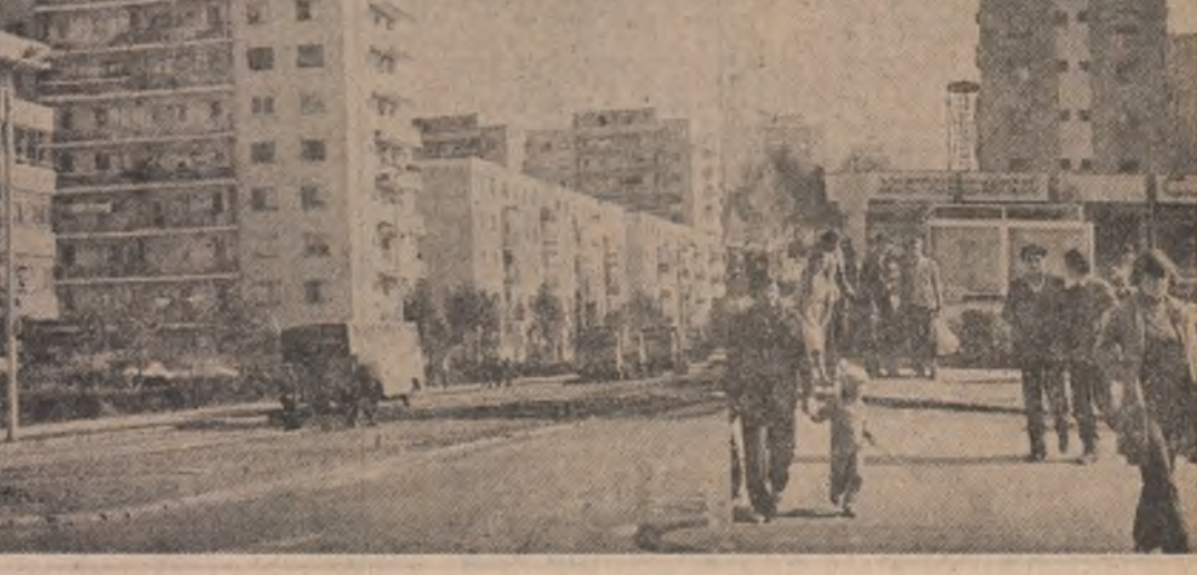
(Continuare în pag. a V-a)