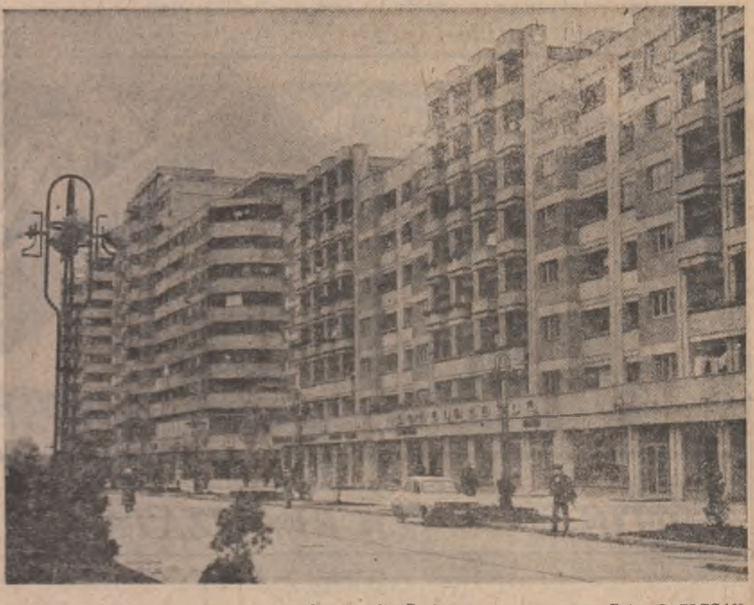
Imagine din Bacău

FLORENȚA MARDALE (Continuare în pag. a V-a)