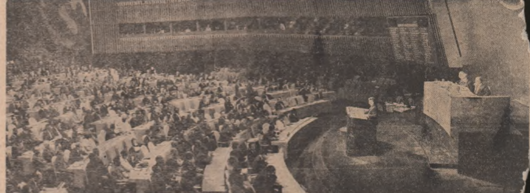
Sub cupola Națiunilor Unite, vocea României răsună împede, ferm, piedina pentru o lume a păcii, înțelegerii și colaborării între națiuni