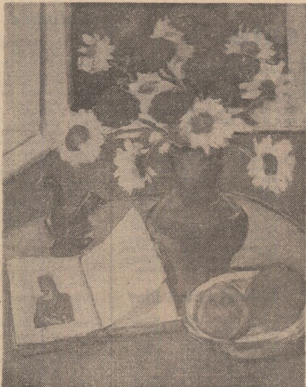
Pictură de THEODOR PALLADY