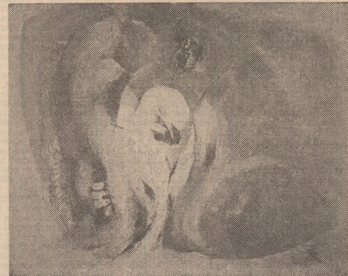
RODICA PANDELE — „Magnolia”