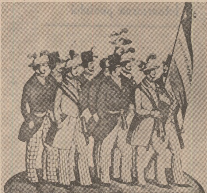
Revoluționari români la 1848

Dualitatea libertate-moarte, devine un leitmotiv al revoluționarilor pașoptiști, pătrunși pînă în fibrele intime ale conștiinței lor de necesitatea imperioasă a momentului ce