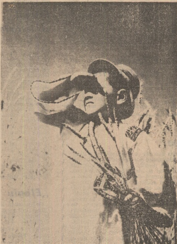
Să te ascunzi, în lan de spice, vară!

Te vei întreba, poate, tînărul meu prieten, ce legătură sau tangență va fi fiind între acest oficiu profund solitar al artei scrisului, practică monahală, o cumpănă care și are un capăt în originea, în chilia, în schitul însoțit al paginii albe și scopul, finalitatea în cristalizarea vocii unice, coerente, din murmurul nedefinit al cititorilor necunoscuți, agora, piața publică, hidra cu mii de capete — adică celălalt capăt al teribilei balanțe? Numai în această ipoteză — că scrisul tău, ca o fragilă, inefabilă ființă va da piept cu leii — hic sunt leones, nu-i așa? — și se cutremură norul, „se spărie gîndul”, cum