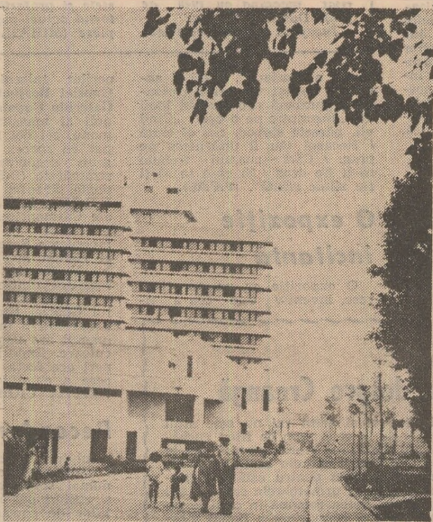
Costinești — spațiu al binemeritatelor vacanțe și, mai ales, al educației complexe și permanente. A început, aici, Gala filmului pentru tineret, acțiune menită să stimuleze creația cinematografică de valoare, ancorată în realitatea fierbinte a patriei.

Nu incapa îndoială că și în planul creației literar-artistice Congresul al IX-lea al partidului a însemnat — la fel ca în toate domeniile de activitate — o adevărată piatră de hotar, de la care, din perspectiva timpului, vor trebui evaluate multe mutații, de structură și de orientare, petrecute în chiar viziunea scriitoricească asupra vieții, a istoriei, prezentului și viitorului.