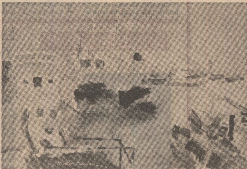
Icodin Dumitru — „Vase pe Dunăre”