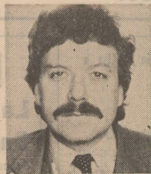
Poeme de Viorel Sâmpetorean

Miinile adulmecîndu-se cu mirare trupul trei sferturi în apă unul nicăieri incă nu știe nimeni ce animal fantastic v-a dat adineauri bună ziua uimit și el de gravitația pămîntului de aerul pe care nu l-ar ști pricepe toată noaptea mesaje non stop de pe discurile neanderthal bună ziua bună ziua cimitirul elefanților un etaj mai jos după semnătura de prezență.