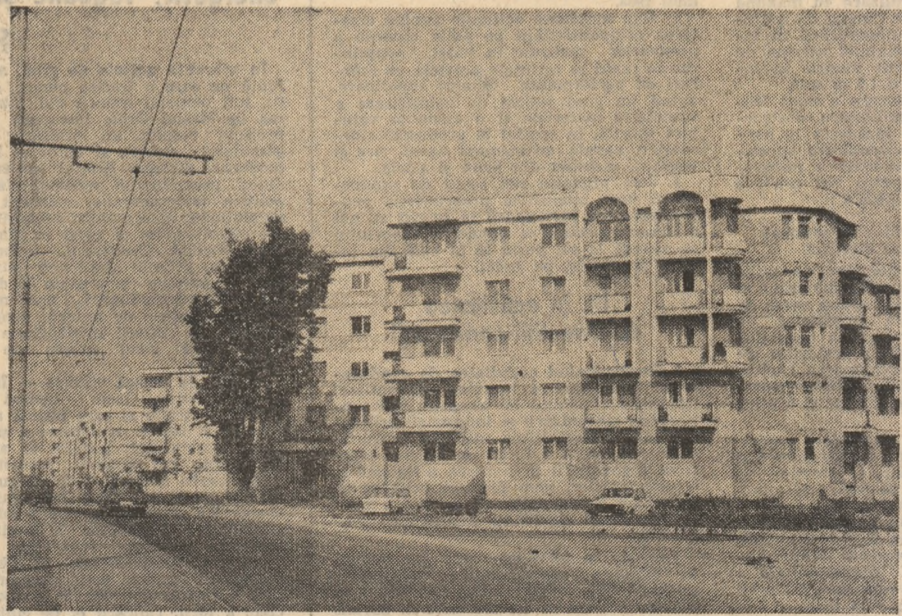
Ritmuri moderne, tinerești pe Șoseaua Pipera