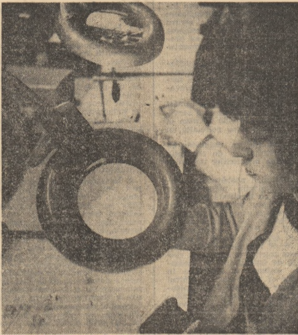
(Continuare în pag. a IV-a)